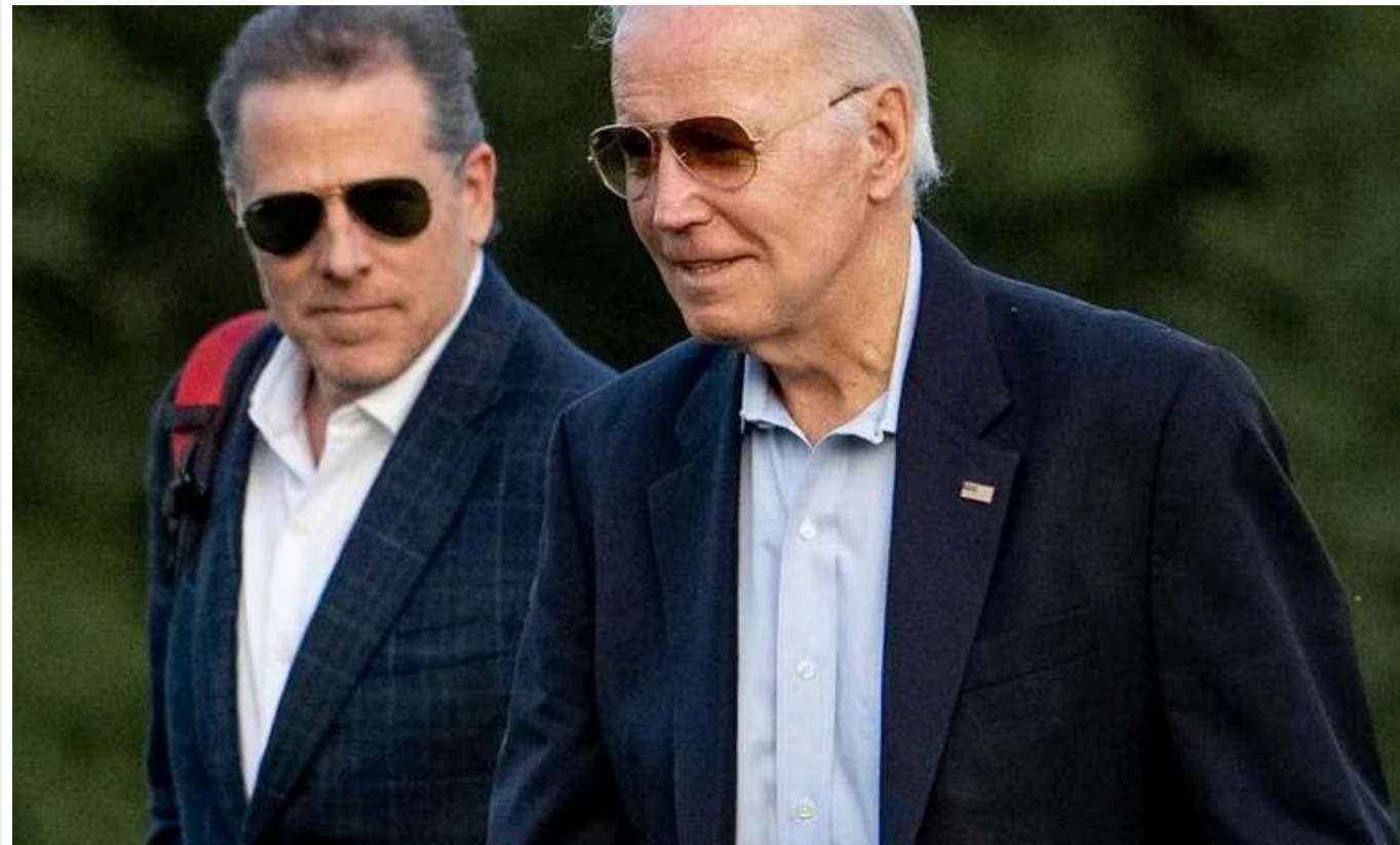
Колишньому інформатору ФБР Смирнову, який розвалив справу проти Байденів, хочуть присудити 6 років тюрми

Колишньому інформатору ФБР Смирнову, який хибно звинувачував Джо Байдена та його сина Гантера в отриманні хабарів, запропонували покарання у вигляді 6 років в'язниці.