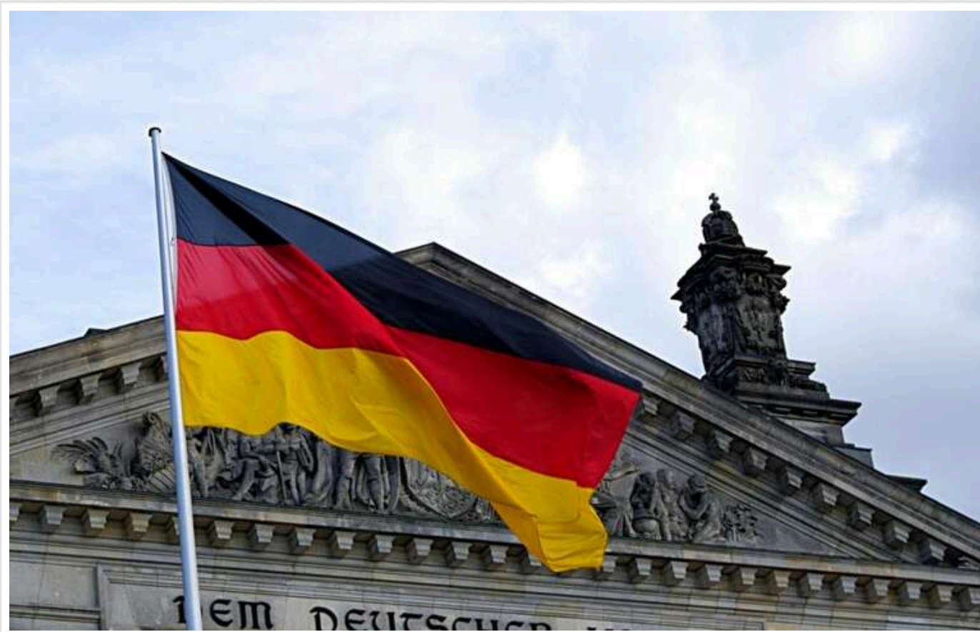
Bild: У Німеччині висловили припущення, що атака БПЛА може бути частиною гібридної війни з боку Росії

Застосування безпілотників для стеження за об'єктами, зокрема військовими, у Німеччині значно збільшується і, ймовірно, є частиною російської гібридної війни, повідомляє Bild з посиланням на представника МВС країни.