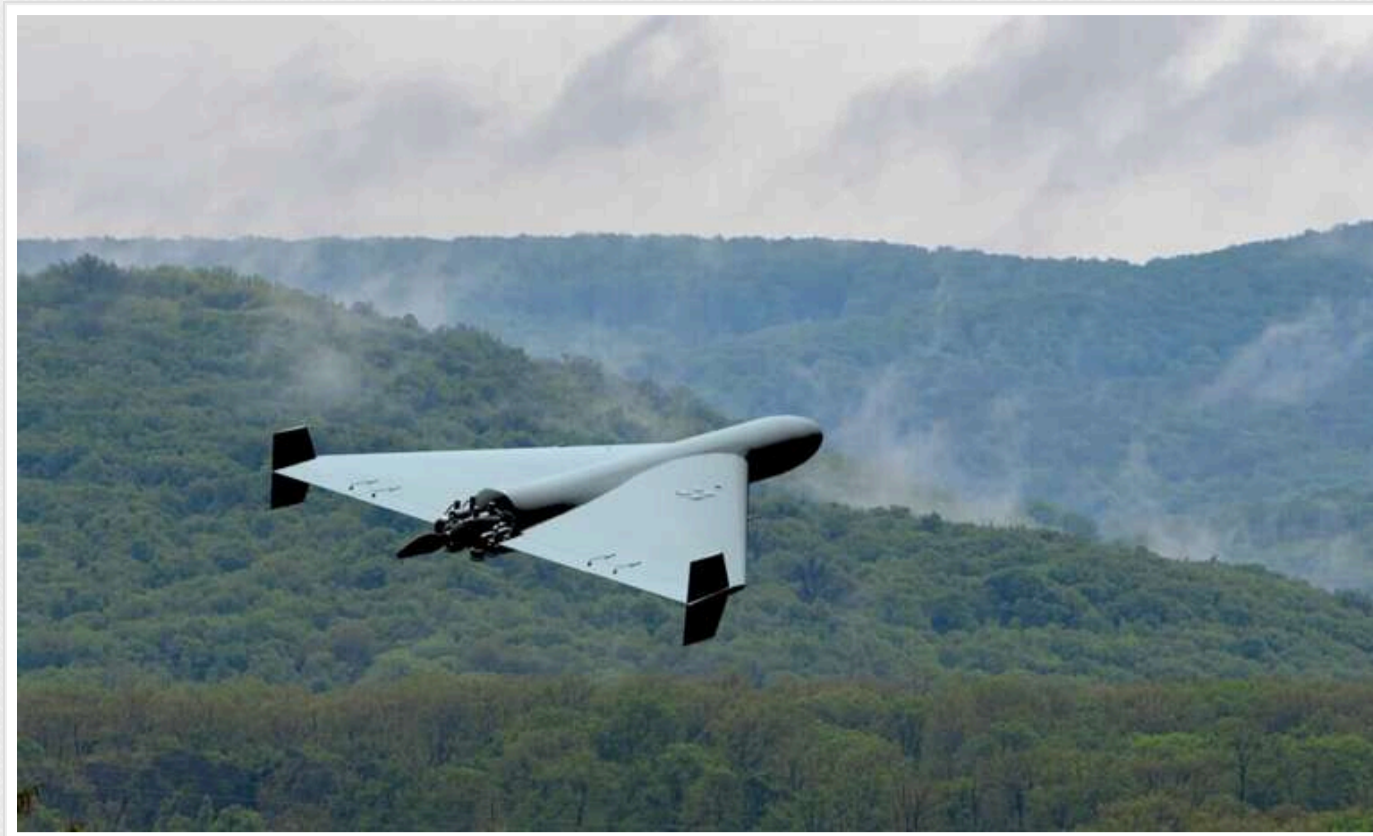
Цієї ночі до Білорусі залетіло понад 15 БПЛА типу "Шахед"

У ніч на 8 січня, під час чергового обстрілу Росією території України, у повітряний простір Білорусі потрапили 17 безпілотних літальних апаратів (БПЛА) типу Shahed.