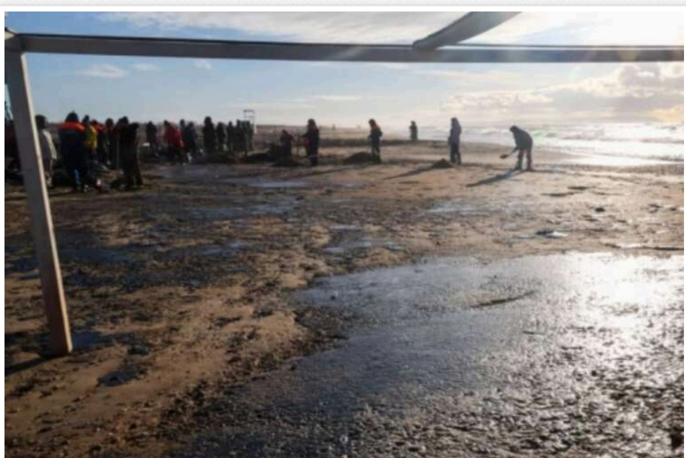
У Севастополі після шторму виникли нові нафтові плями внаслідок аварії танкерів РФ

У тимчасово окупованому Севастополі після шторму виявлено нові нафтові плями через аварію російських танкерів. Вони з'явилися в районі пляжів "Любимівка" та "Зоряний берег".