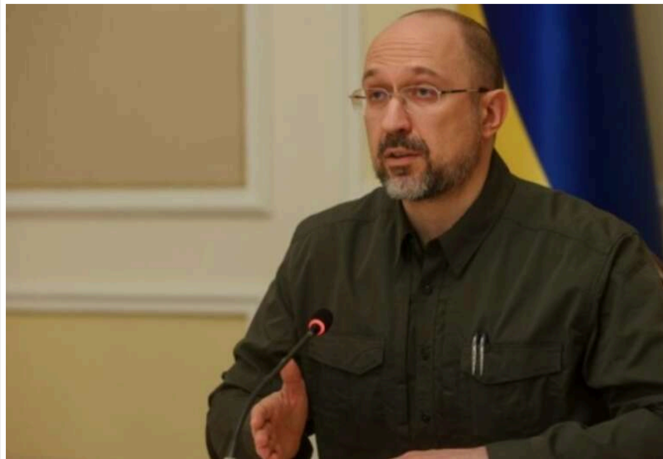
Депутати викликали у Раду міністра Шмигала

Народні депутати України запросили Прем'єр-міністра Дениса Шмигала на засідання парламенту.