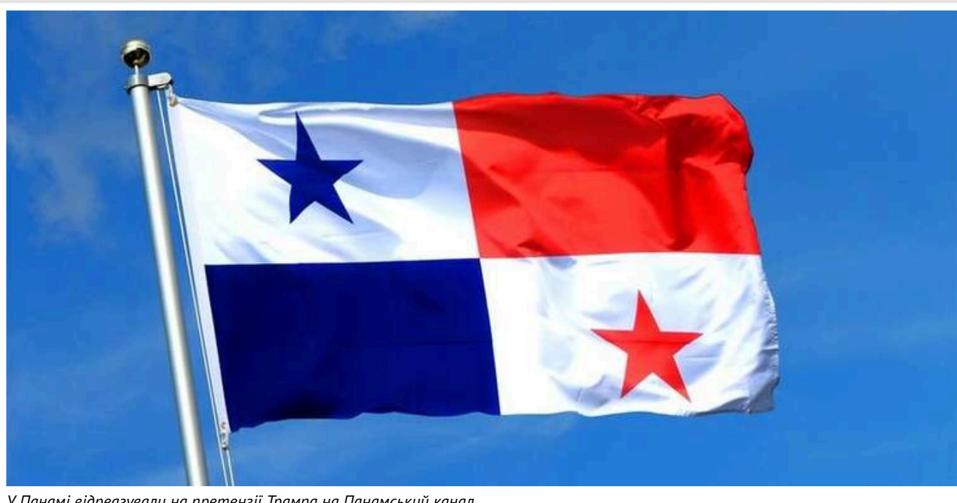
У Панамі відреагували на претензії Трампа на Панамський канал

У Панамі підкреслили, що суверенітет Панамського каналу не є предметом обговорення. Ніяких переговорів з новообраним президентом США Дональдом Трампом щодо цього не відбувалося.