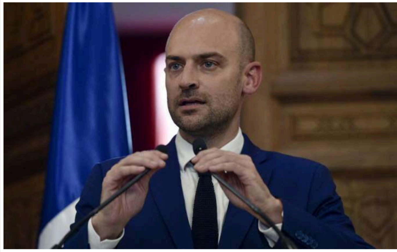
У Франції відреагували на заяві Трампа з приводу Гренландії

Відповідаючи на заяві 47-го президента США Дональда Трампа про зацікавленість у Гренландії, міністр закордонних справ Франції Жан-Ноель Барро підкреслив, що Європейський союз не допустить втручання у свої кордони.