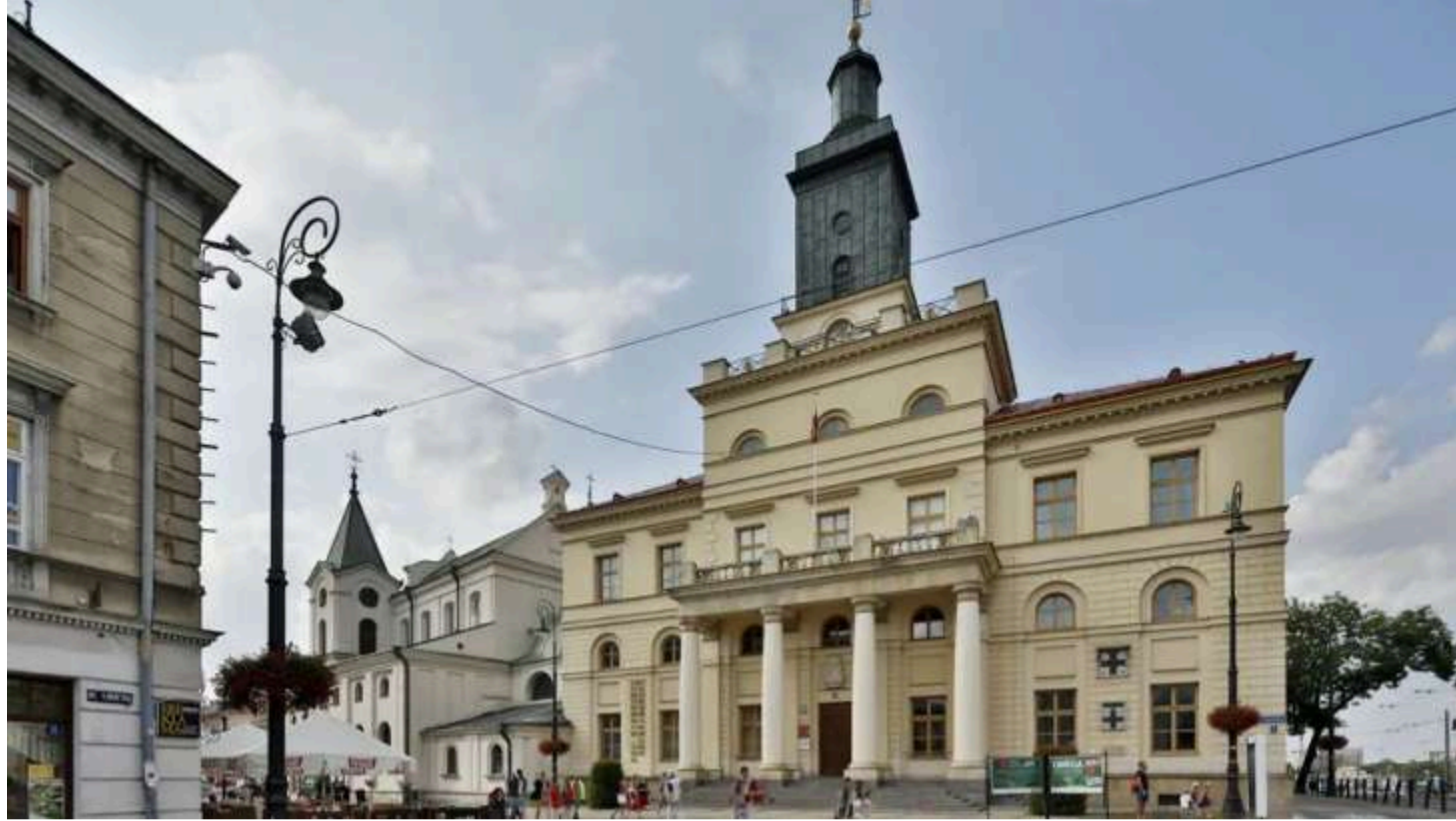
Фото: Люблінська ратуша/East News/Бартош Маковські/РЕПОРТЕР

У польському Любліні з будівлі міської ради зняли прапор України. Причиною став указ президента Володимира Зеленського про надання одному з підрозділів Сил спеціальних операцій почесного найменування «імені Героїв УПА». Про це пише польське видання WP Wiadomości.