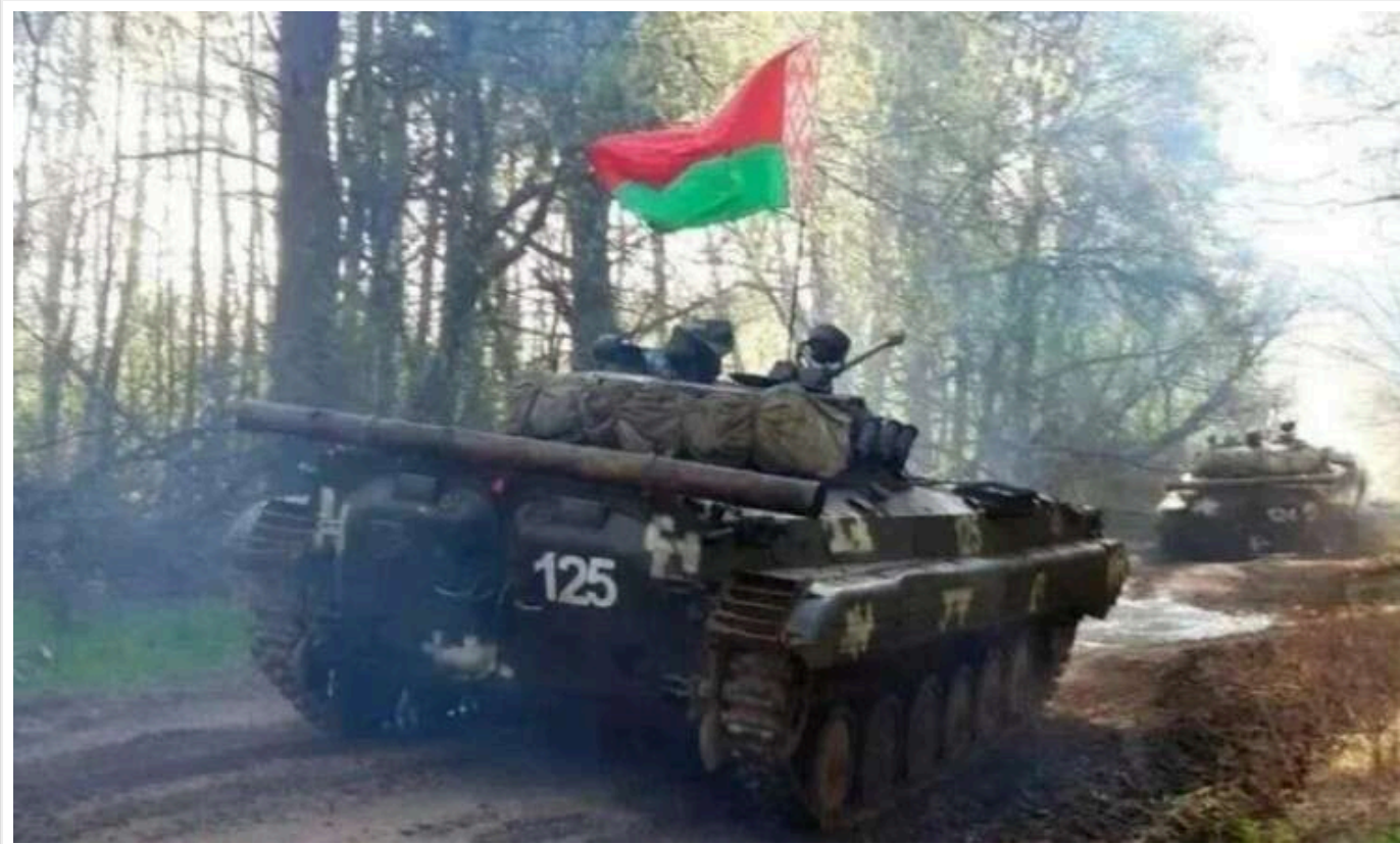
Білорусь збільшила військову присутність на українському кордоні, – "Гаюн"

Білорусь почала збільшувати військову присутність біля кордону з Україною, повідомляє моніторинговий проєкт "Беларускі Гаюн".