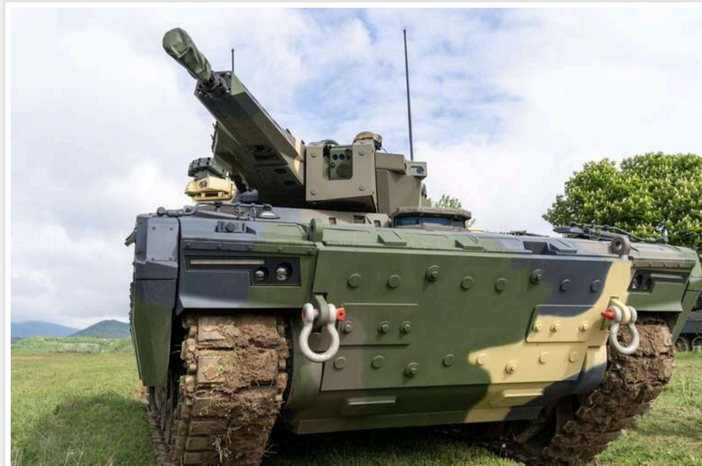
ЗСУ отримали першу БМП Lynx від Rheinmetall

Німецький оборонний концерн Rheinmetall уже передав Україні нову бойову машину піхоти KF41 Lynx. Це відбулося наприкінці 2024 року.