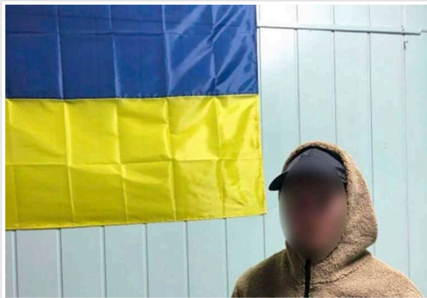
Україна повернула ще трьох дітей з російської окупації

Три дитини були повернуті Україною з тимчасово окупованих територій. Завдяки цьому вдалося возз'єднати сім'ю.