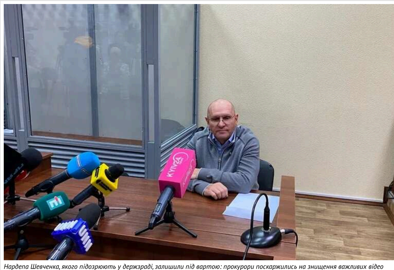
Нардепа Шевченка, якого підозрюють у держзраді, залишили під вартою: прокурори поскаржились на знищення важливих відео

Депутат Верховної Ради України Євген Шевченко залишиться в СІЗО до 7 березня 2025 року – без можливості внесення застави. Політик з 14 листопада 2024 року підозрюється у державній зраді, а з 15 листопада перебуває під арештом.