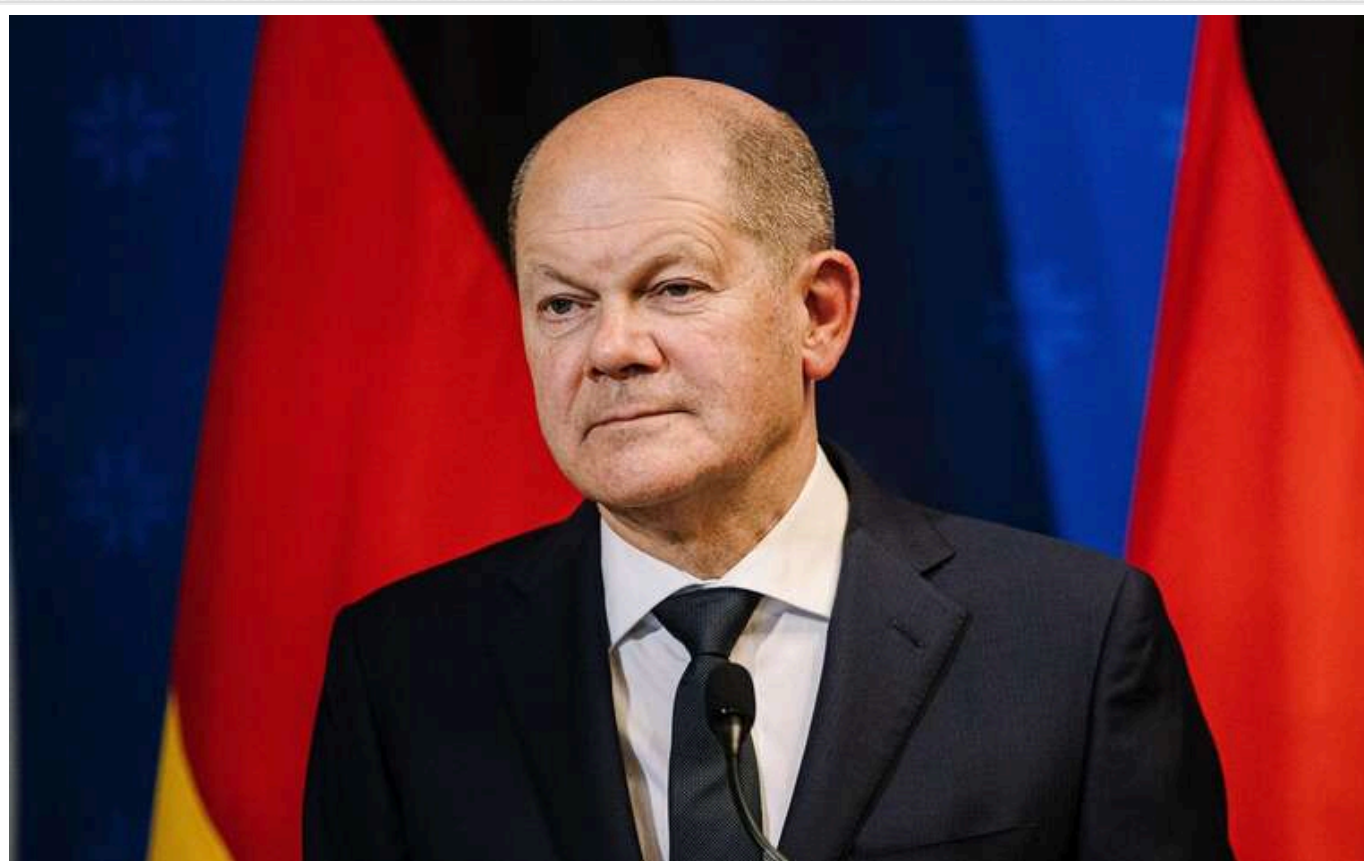
Шольц розкритикував збільшення витрат на оборону до 3,5 відсотка ВВП

Шольц висловив критику на адресу ідеї підняти оборонний бюджет Німеччини до 3,5% від ВВП.