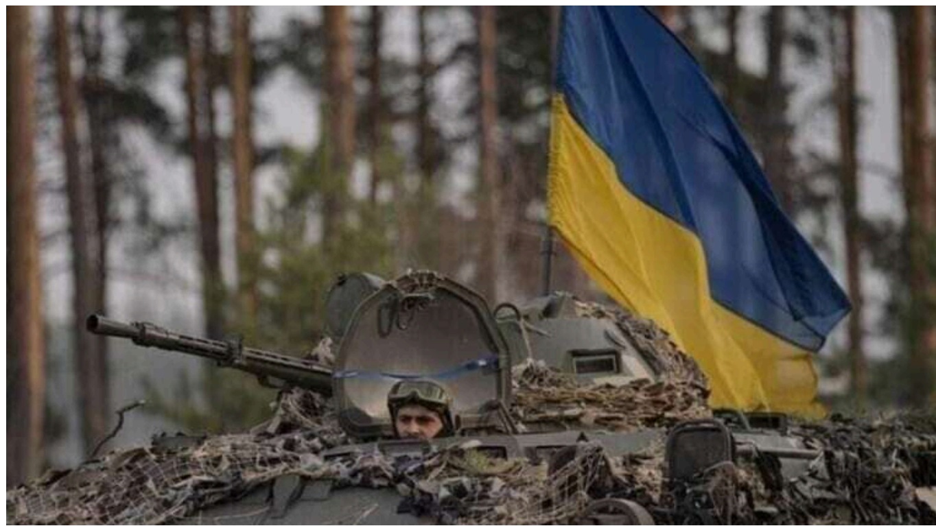
Ситуація на фронті: з початку доби на лінії фронту відбулося 108 бойових зіткнень

Станом на 16:00 понеділка, 6 січня 2025 року, на лінії фронту відбулося 108 боєзіткнень.