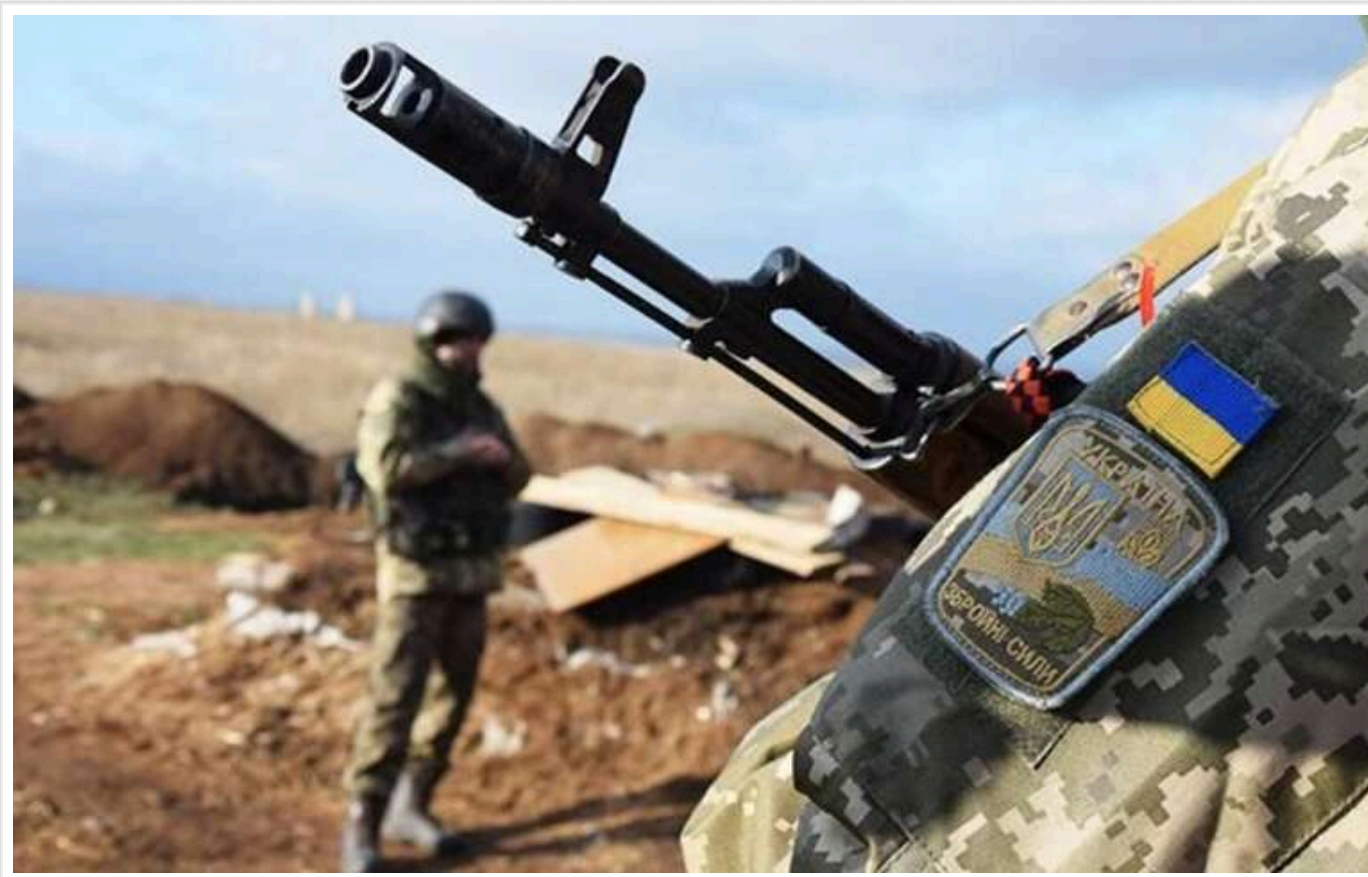
На Куп'янському напрямку батальйон Ахіллес разом з нацгвардійцями і десантниками відбив два штурми окупантів

3 та 4 січня батальйон ударних безпілотних авіаційних комплексів Ахіллес 92-ї ОШБр разом із гвардійцями бригади НГУ Буревій та десантниками 77-ї окремої аеромобільної бригади відбив два штурми на Куп'янському напрямку в районі села Загризове.