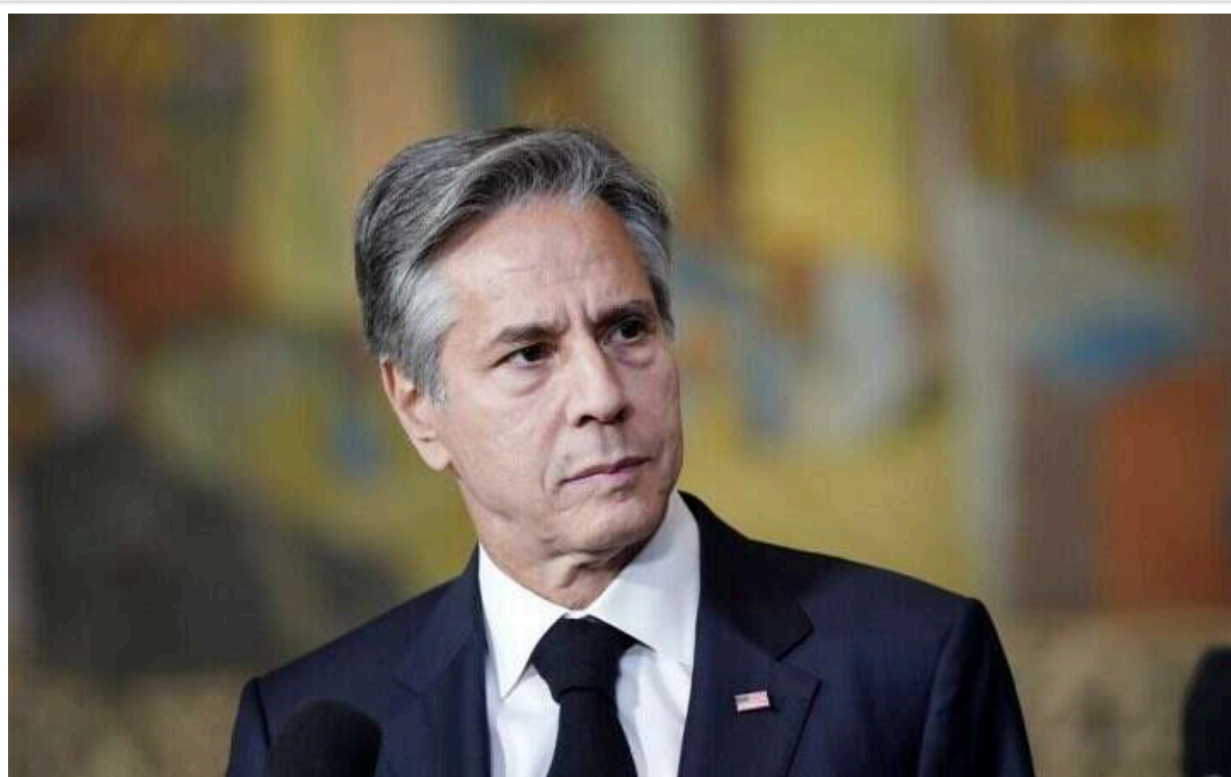
Блінкен прагне просунути угоду про припинення вогню в Газі до "фінішної прямої"

Держсекретар США Антоні Блінкен у понеділок закликав зробити останній крок до угоди про припинення вогню в Газі до того, як президент Джо Байден залишить свою посаду.