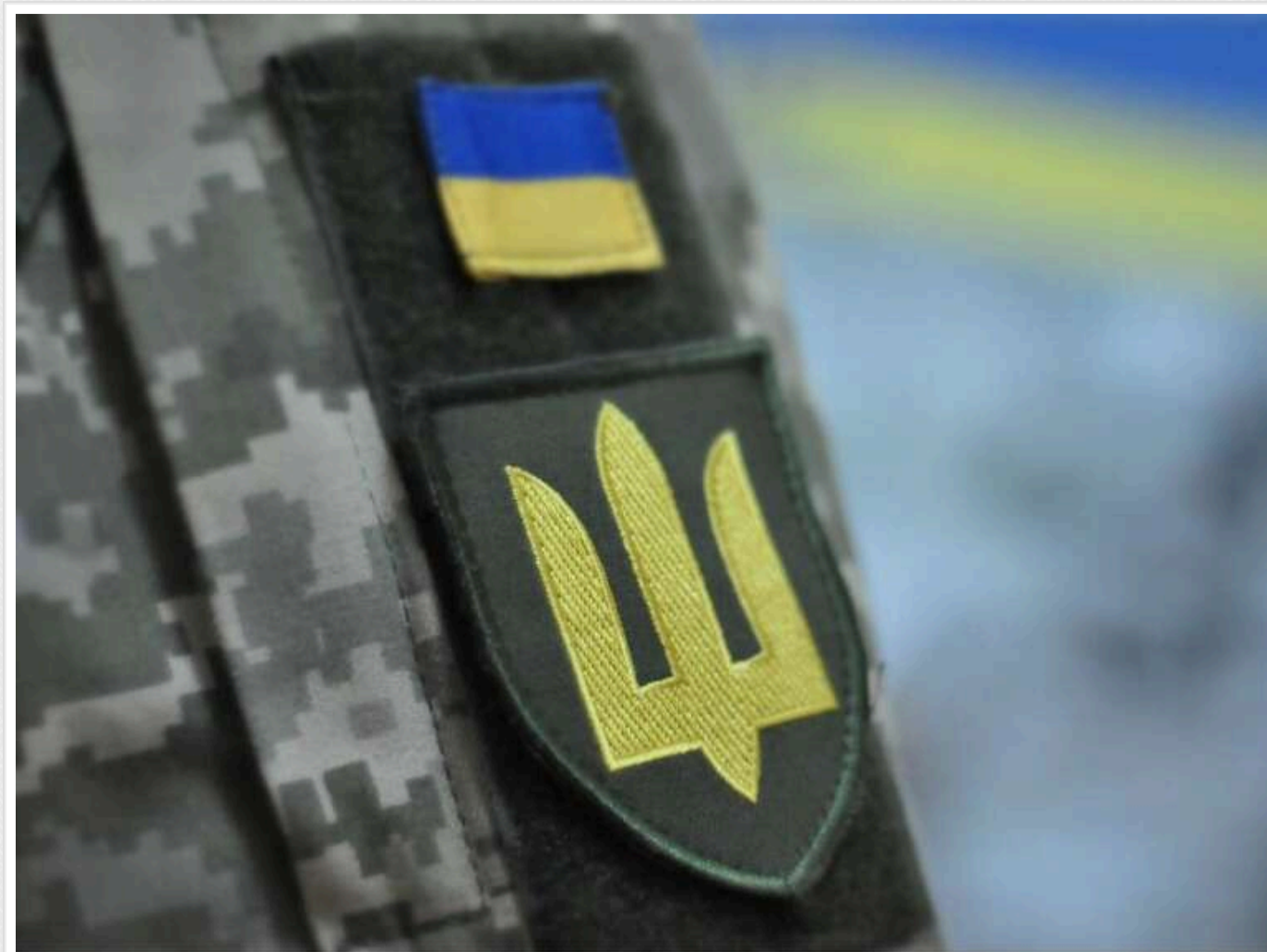
Співробітника ТЦК затримали на хабарі у Вінниці

Правоохоронці затримали військовослужбовця взводу охорони Вінницького РТЦК та СП на хабарі у 16 тисяч доларів. Він видавав справжні повістки з датою на декілька місяців наперед.