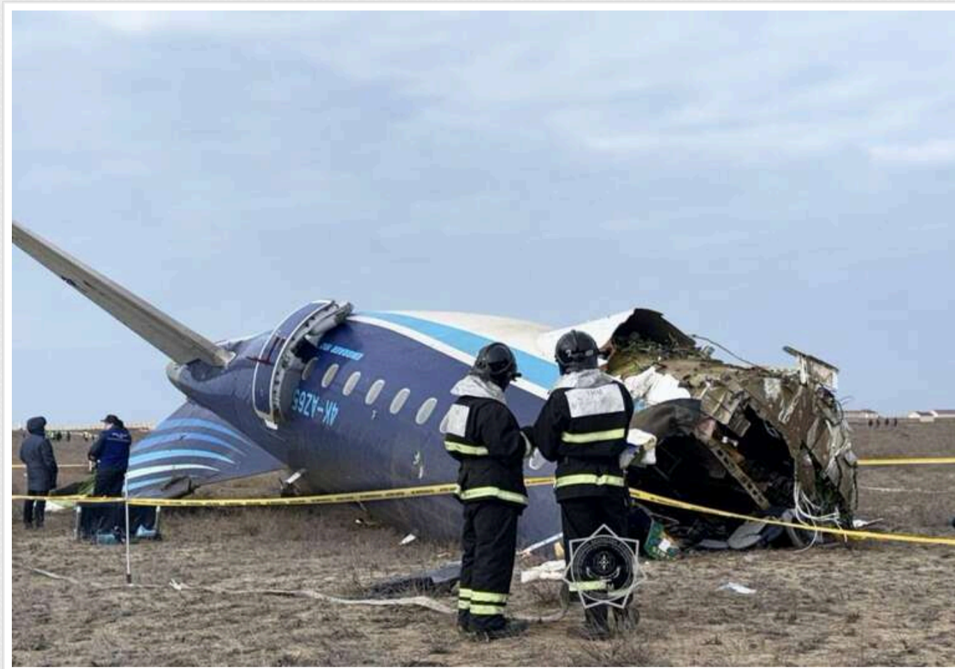
Ільхам Алієв знову звинуватив РФ в катастрофі літала AZAL

Глава Азербайджану знову звинуватив Росію в катастрофі літака AZAL у грудні та в намаганні зам'яти деталі інциденту.