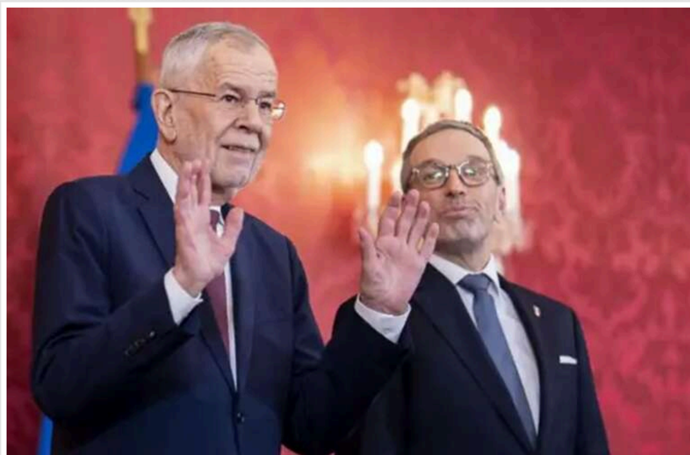
В Австрії президент доручив сформувати уряд лідеру проросійської Партії свободи

"Переломний момент в історії Австрії". Лідер ультраправого руху, що виступає проти підтримки України, стане керівником уряду.