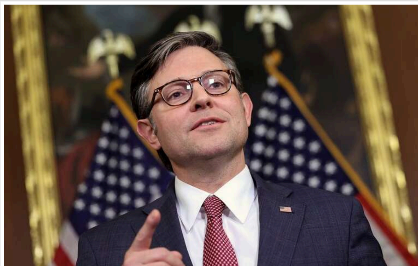
Майк Джонсон: Зимовий шторм не завадить підтвердити перемогу Трампа в Конгресі США

Сьогодні в Конгресі США мають офіційно підтвердити обрання Дональда Трампа на посаду президента. І сильний зимовий шторм, який насувається на Сполучені Штати, не завадить цьому процесу.