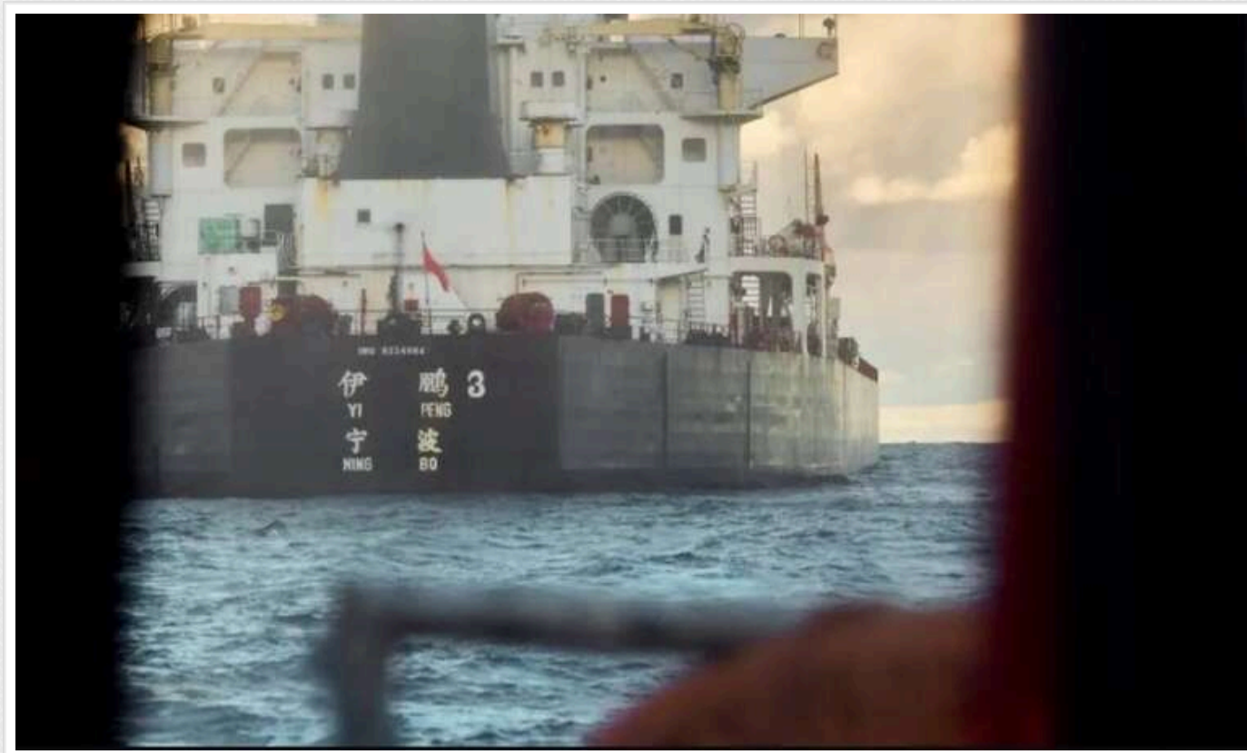
Тайвань звинуватив Китай у пошкодженні підводного кабелю

Тайвань оголосив про пошкодження підводного інтернет-кабелю біля північного узбережжя острова, в чому підозрюється китайське вантажне судно. Унаслідок цього інциденту тимчасово порушилося з'єднання, а Тайвань звернувся до Південної Кореї з проханням провести розслідування та затримати судно.