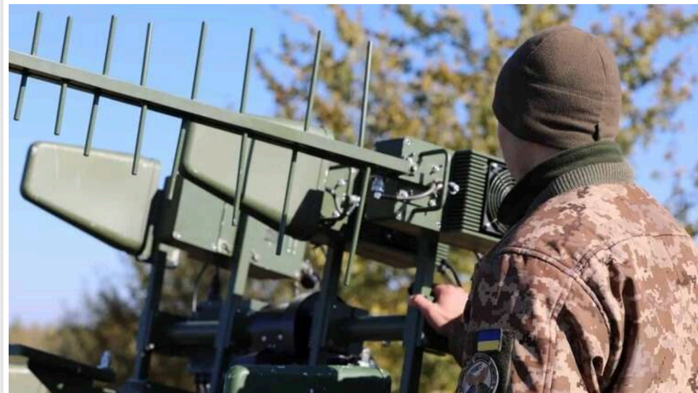
ISW: У Росії запанікували через можливості РЕБ Сил оборони

Російські джерела висловили занепокоєння щодо здатності військових армії РФ відповідати на тривалі загальновійськові зусилля України з інтеграції можливостей радіоелектронної боротьби (РЕБ), зокрема здатності українських сил завдавати удари великої дальності разом із проведенням наземних операцій.