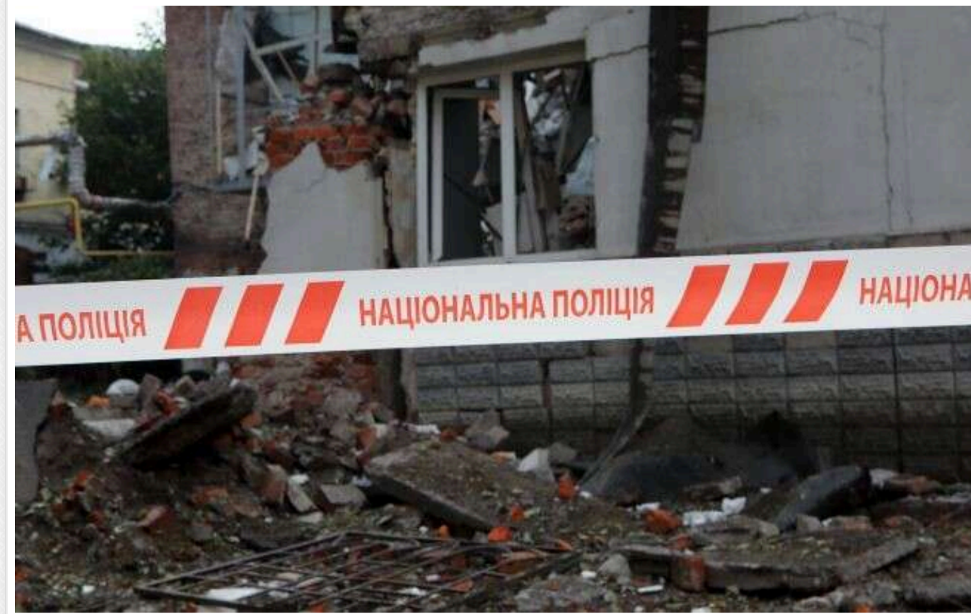
На Херсонщині загинув цивільний унаслідок ворожих обстрілів

Російські війська 5 січня знову обстріляли населені пункти Херсонської області, використовуючи артилерію, міномети та дрони. Унаслідок атак загинув один цивільний, ще 12 осіб дістали поранення.