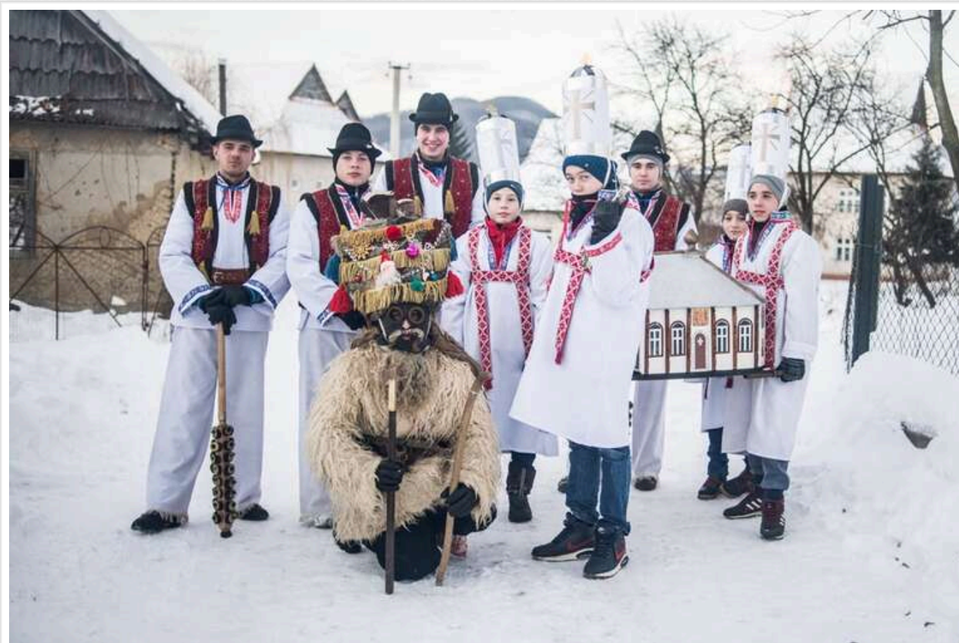
На окупованій території Луганщини вимагають заборонити «колядників»

«Представники «міністерства ЖКГ ЛНР» звернулися до керівників ОСББ («об'єднання співвласників багатоквартирного будинку», аналог ТСЖ в Україні) з вимогою заборонити колядників».