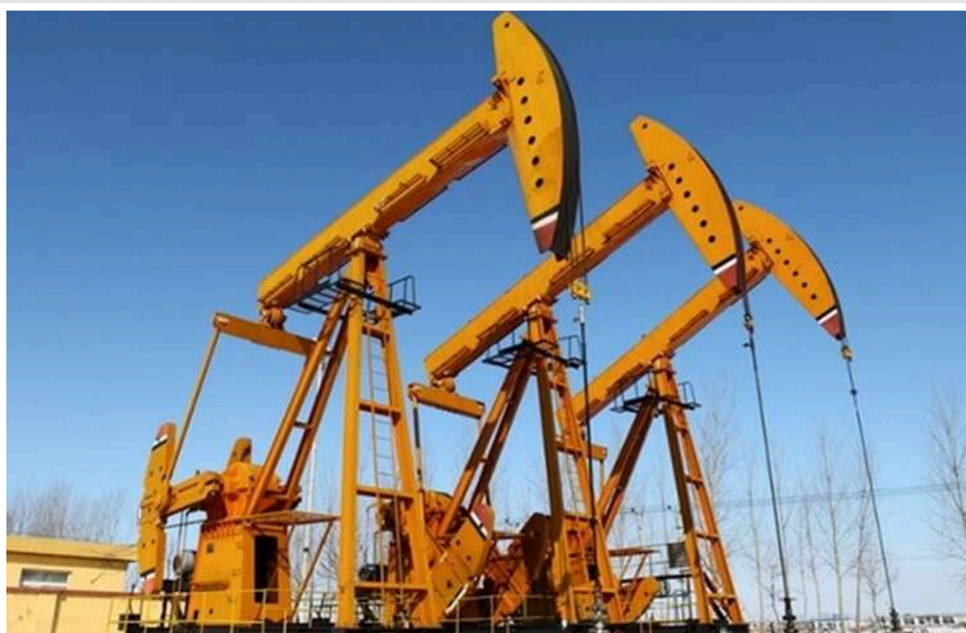
Через загрозу санкцій США Сербія шукає нові шляхи постачання нафти та газу

США можуть запровадити санкції проти Нафтогазової індустрії Сербії (NIS) через російську власність. Сербія планує створити Координаційний орган для забезпечення постачання нафти та газу, щоб вирішити цю проблему.