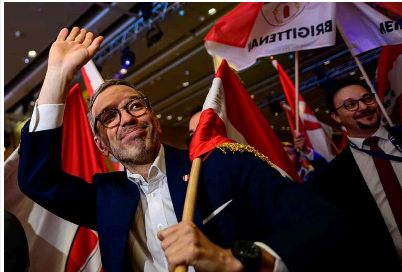
Новим главою уряду Австрії може стати лідер ультраправої «Партії свободи» Герберт Кікль

Після відставки канцлера Австрії Карла Негаммера, новим керівником уряду може стати лідер ультраправої «Партії свободи» Герберт Кікль. Президент країни вже запросив його до себе, щоб, за інформацією австрійських ЗМІ, доручити Кіклю створення правлячої коаліції в парламенті.