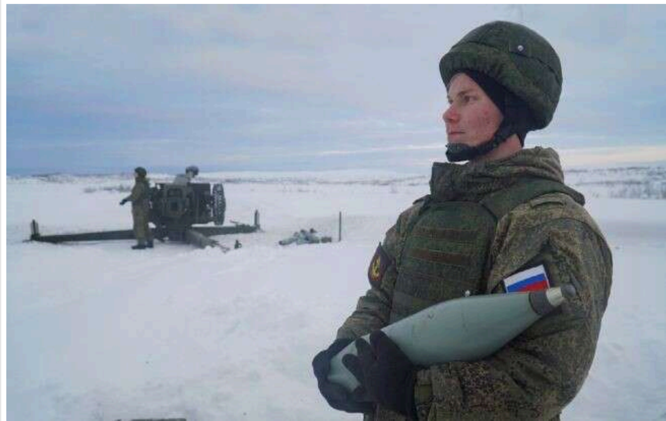
В ОВА заявили, що обстріли Сумської області зросли у чотири рази

Обстріли Сумської області зросли у чотири рази порівняно з минулим роком. Ворог використовує нові методи атак.