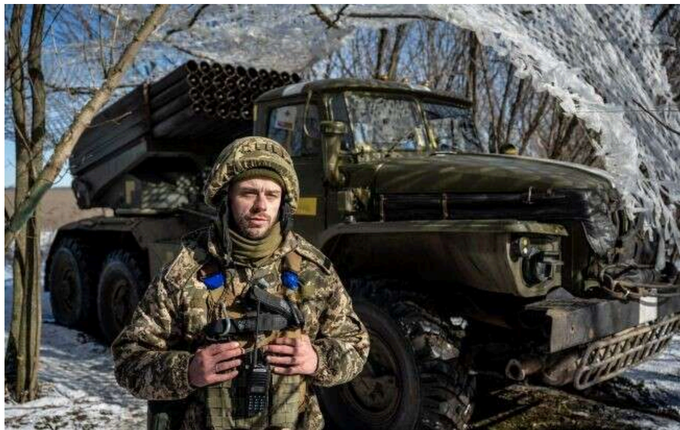
Ситуація на фронті: На Курщині відбулося 42 боєзйткнення, 12 досі тривають

Загалом з початку доби, 5 січня 2025 року, на фронті відбулося 106 бойових зіткнень.