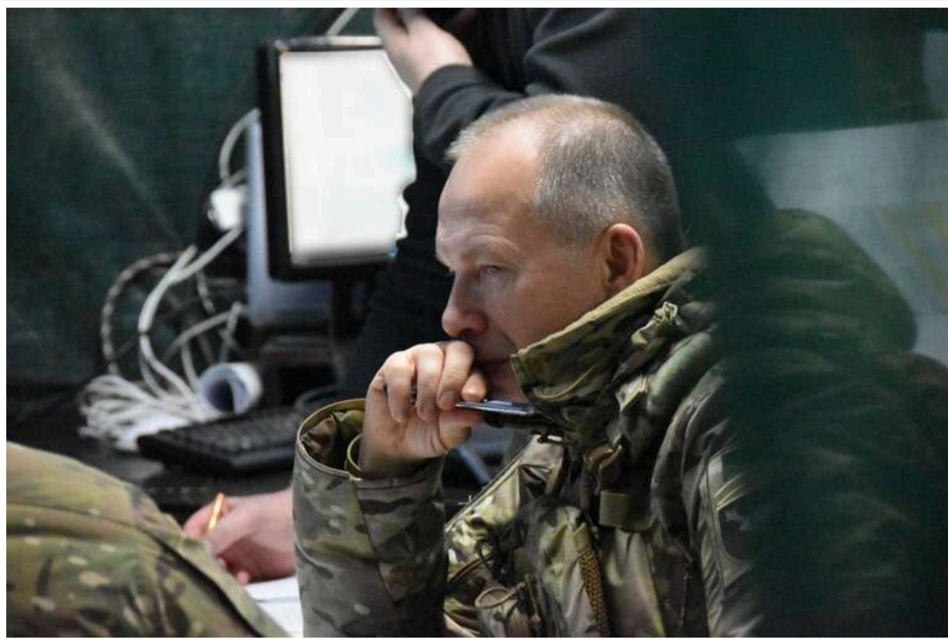
Сирський наказав посилити скандальну 155 бригаду

Головнокомандувач ЗСУ Олександр Сирський доручив посилити 155-ту окрему механізовану бригаду імені Анни Київської. Правоохоронці розслідують випадки дезертирства та нестачі особового складу у бригаді.