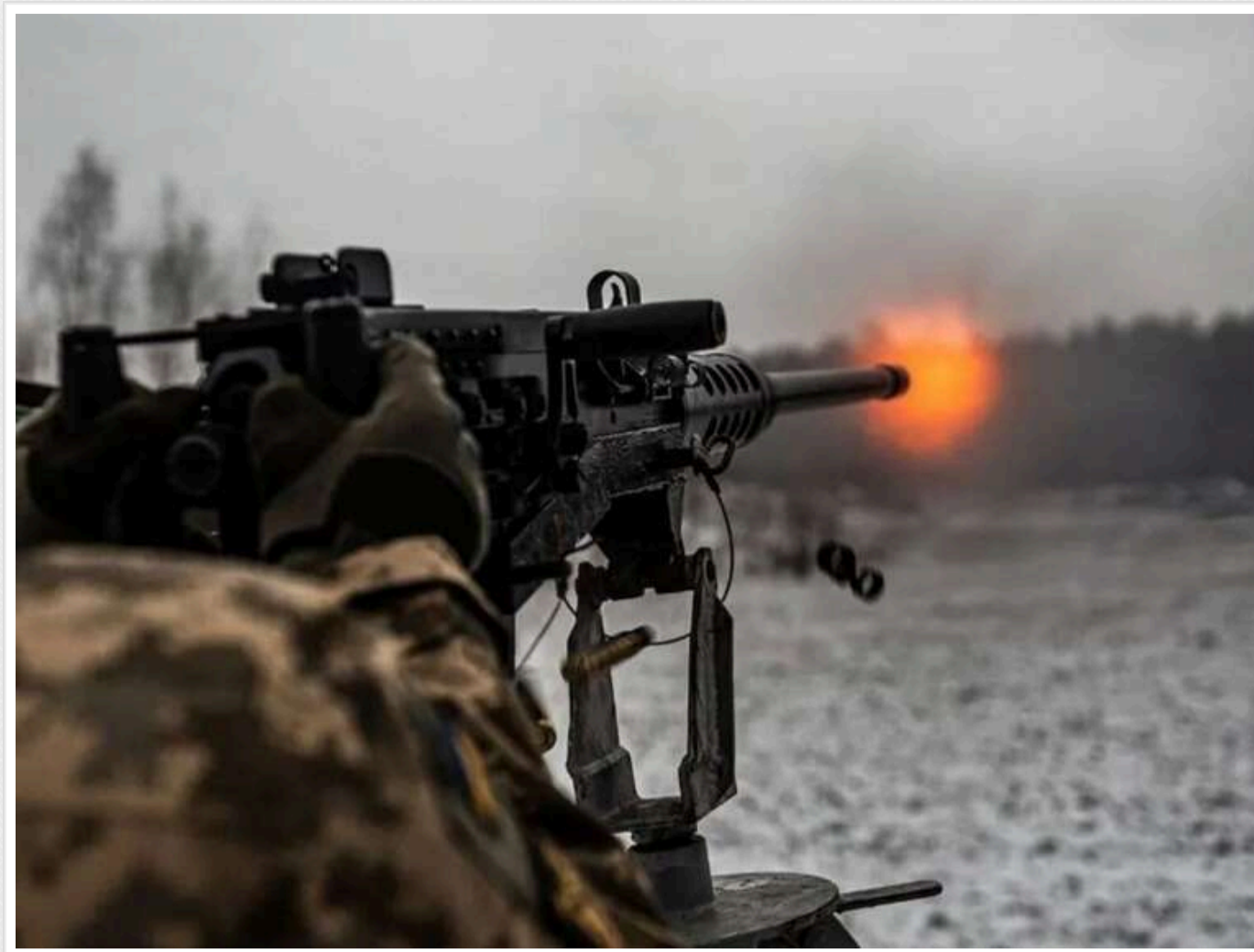
В ЗСУ показали зачистку позицій ворога на Харківщині

На Харківщині українські військові захопили позиції російських окупантів. На одній із ділянок фронту штурмовики 1-го механізованого батальйону 3-ї окремої штурмової бригади зачистили окопи, в яких перебували загарбники.