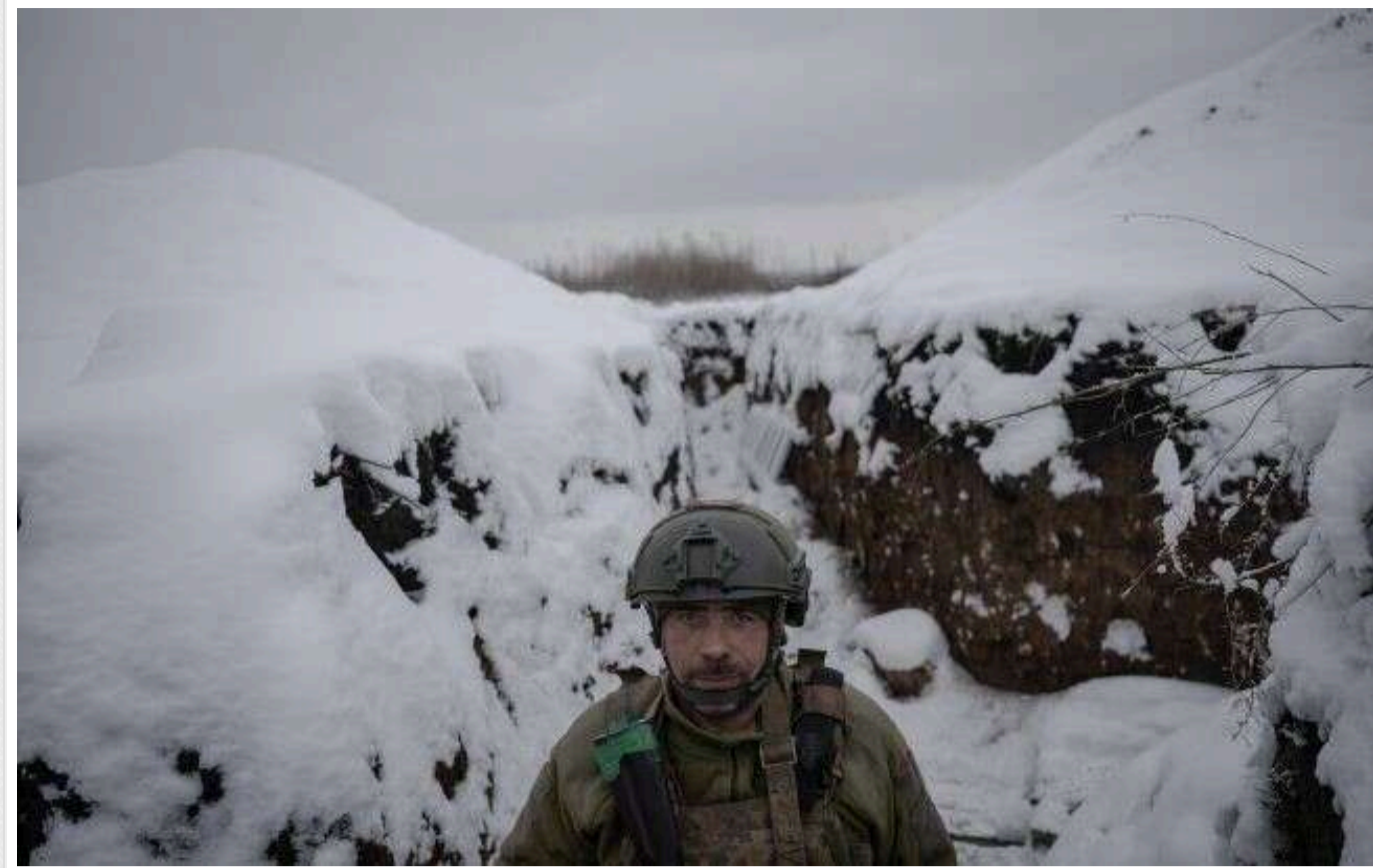
У ЗСУ розповіли про тактику штурмів армії РФ на сході

Під час боїв на сході України загарбники намагаються закріпитися у посадках або міській забудові під час штурмів. Так вони діють на всіх напрямках.