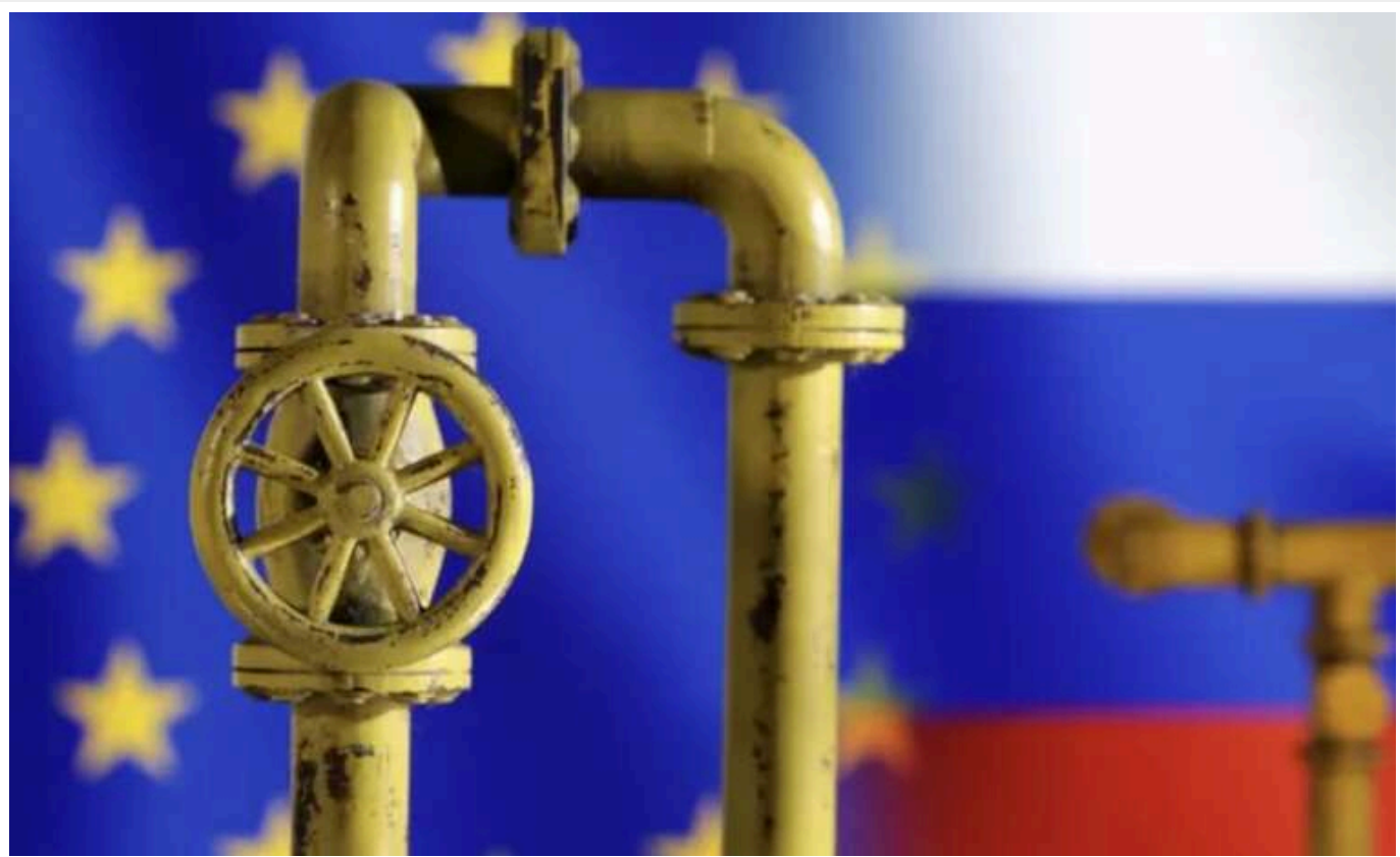
Придністров'я відмовилось від закупівель газу в ЄС

У Придністров'ї з 3 січня діють суворі графіки віялових відключень електроенергії через дефіцит енергоресурсів. Кризу поглибила відмова сепаратистської влади від європейської допомоги та закупівель газу на відкритих ринках.