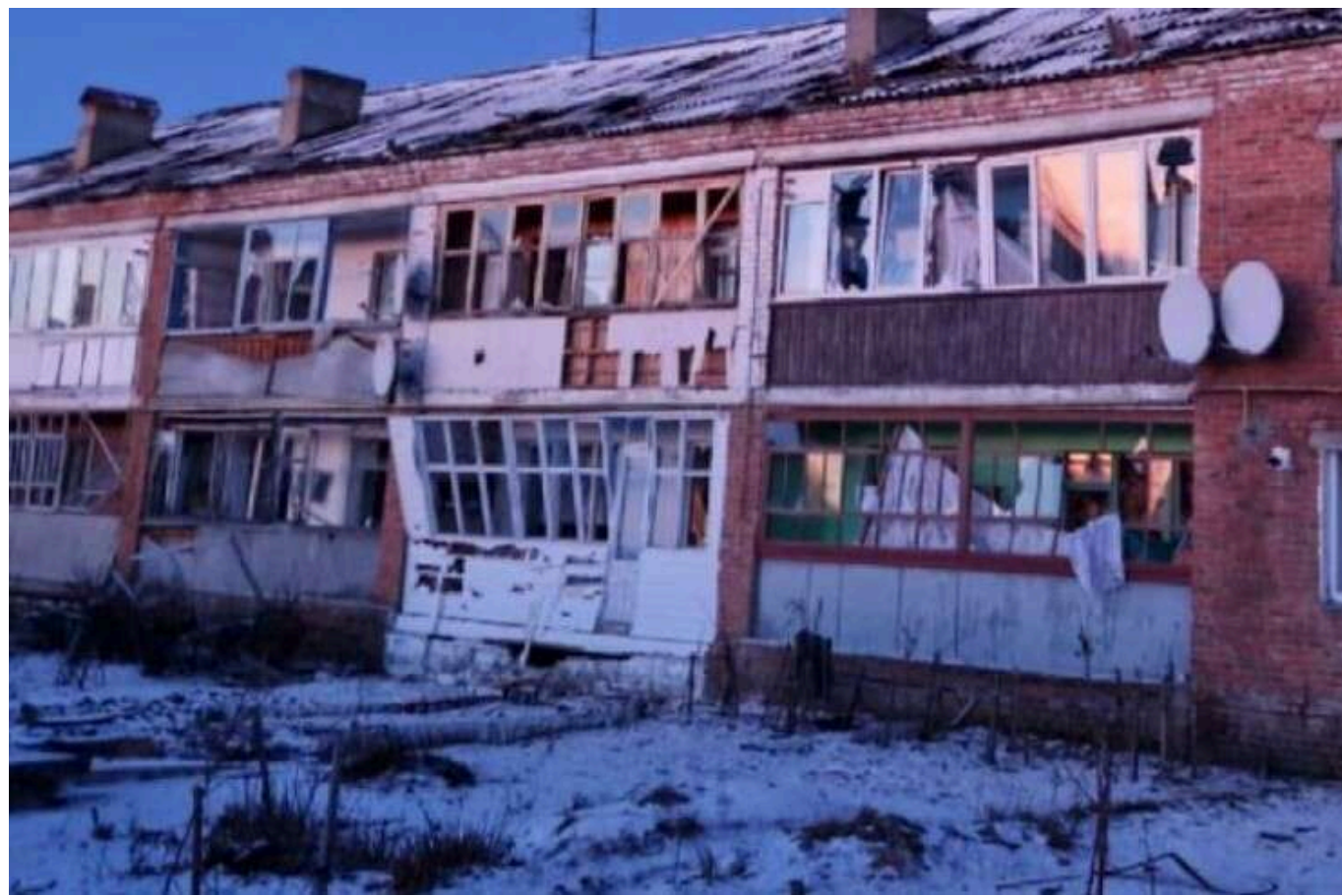
У Чернігівській області збільшилась кількість постраждалих внаслідок удару РФ по Семенівці

Кількість поранених внаслідок авіаудару Росії по Семенівці Чернігівської області збільшилася. Дев'ять осіб отримали поранення.