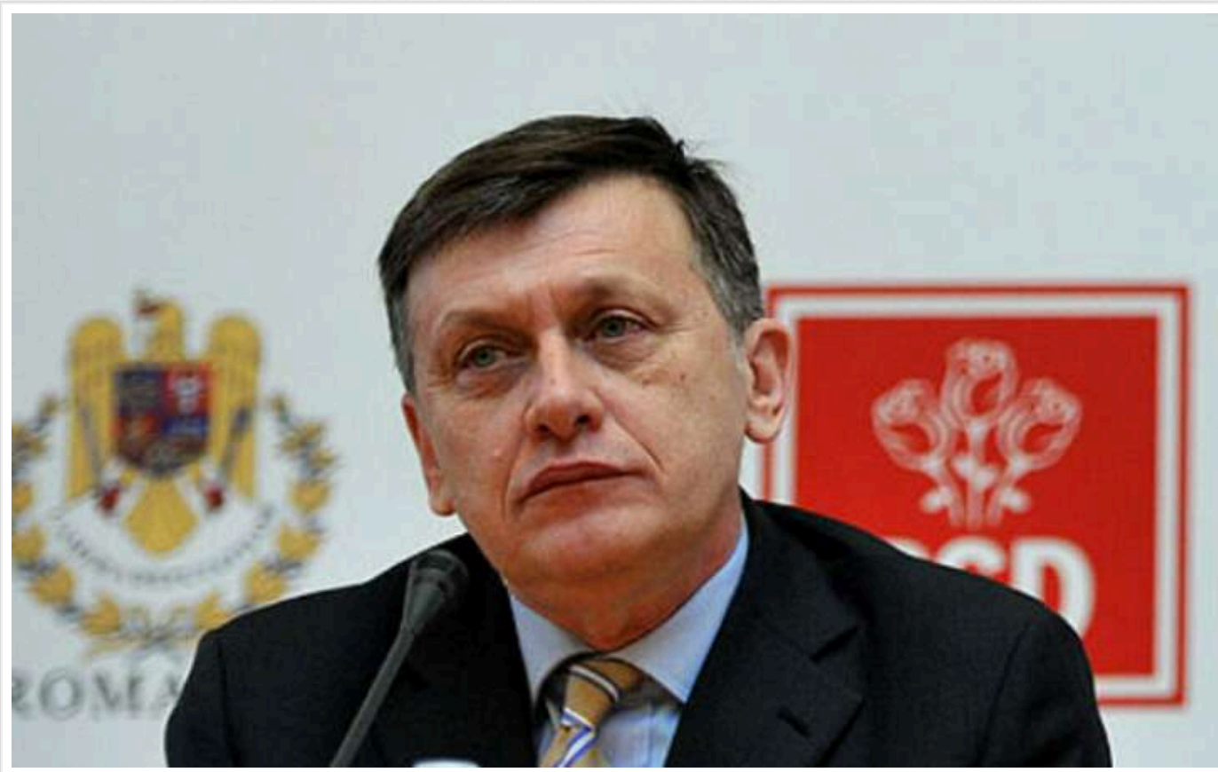
У Румунії кандидат у президенти від партії влади заявив про призупинення кампанії

Підтриманий трьома партіями урядової коаліції в Румунії кандидат на посаду президента Крін Антонеску оголосив про призупинення своєї кампанії, звинувативши партії влади у відсутності підтримки.