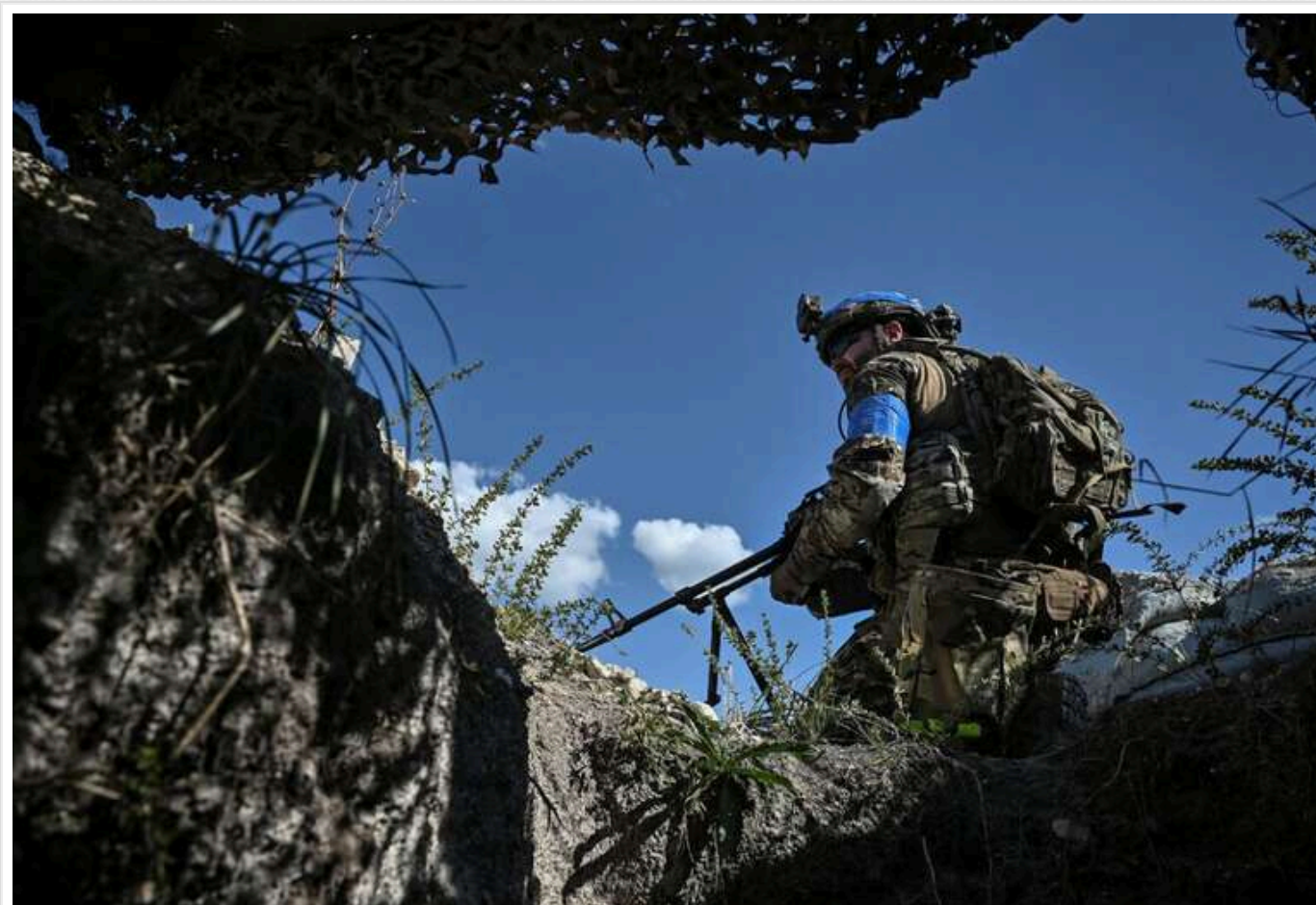
Втрати ворога: ліквідовано 1730 російських солдатів та 25 артсистем

За останню добу, з 4 на 5 січня, російські військові втратили на фронті 1730 солдатів, 91 безпілотний літальний апарат і 26 бойових броньованих машин.