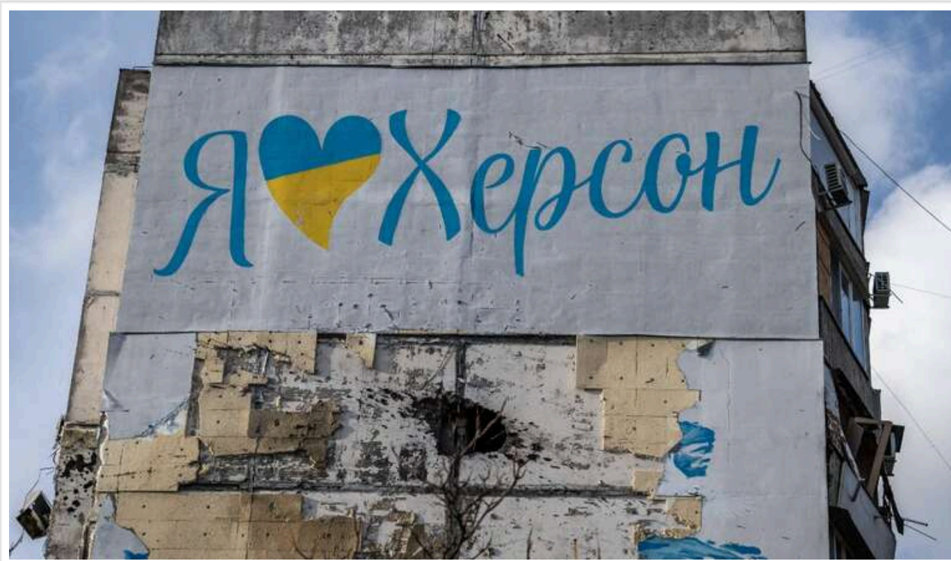
На Херсонщині за минулу добу внаслідок російських атак отримали поранення дев'ятеро осіб

На Херсонщині вчора, 4 січня, внаслідок російських ударів отримали поранення дев'ятеро людей.