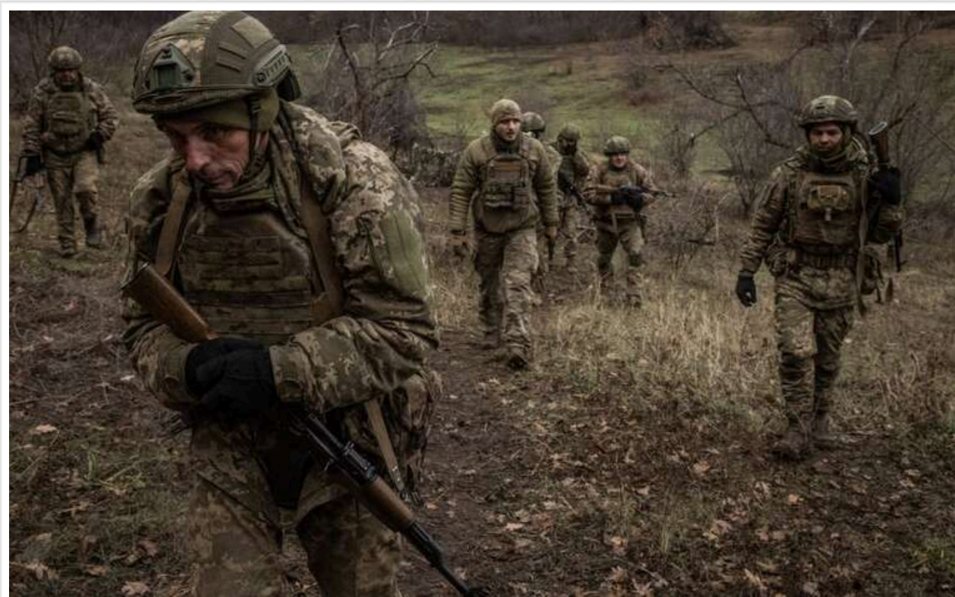
Зараз ситуація гірша, ніж на початку повномасштабного вторгнення, – командир роти 35-ї бригади

Командир роти 35-ї бригади Збройних сил України заявив, що ситуація на фронті стала гіршою, ніж на початку повномасштабного вторгнення Росії. За його словами, війська противника продовжують нарощувати свої сили, а інтенсивність боїв зростає з кожним місяцем.