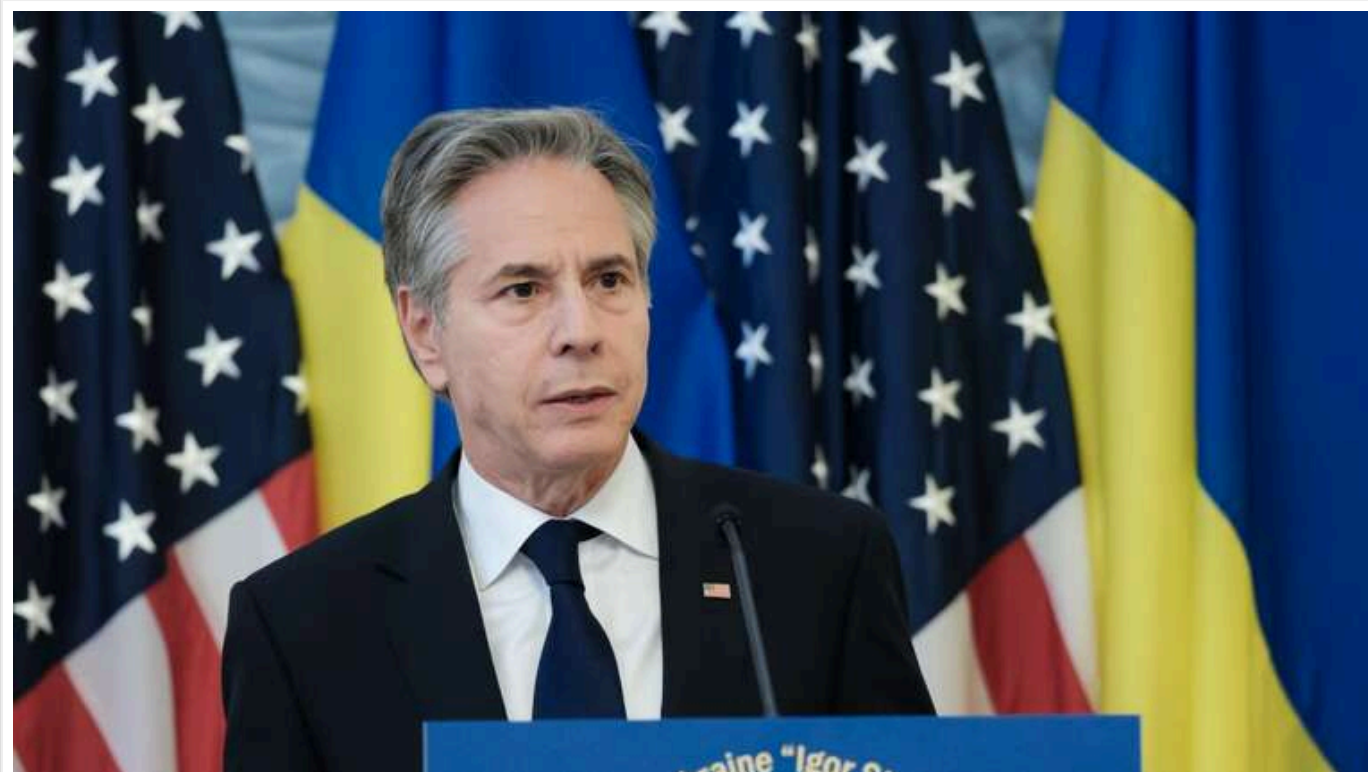
Лінія фронту в Україні, ймовірно, не зазнає значних змін в результаті війни, - Блінкен

Про це повідомив державний секретар США Ентоні Блінкен.