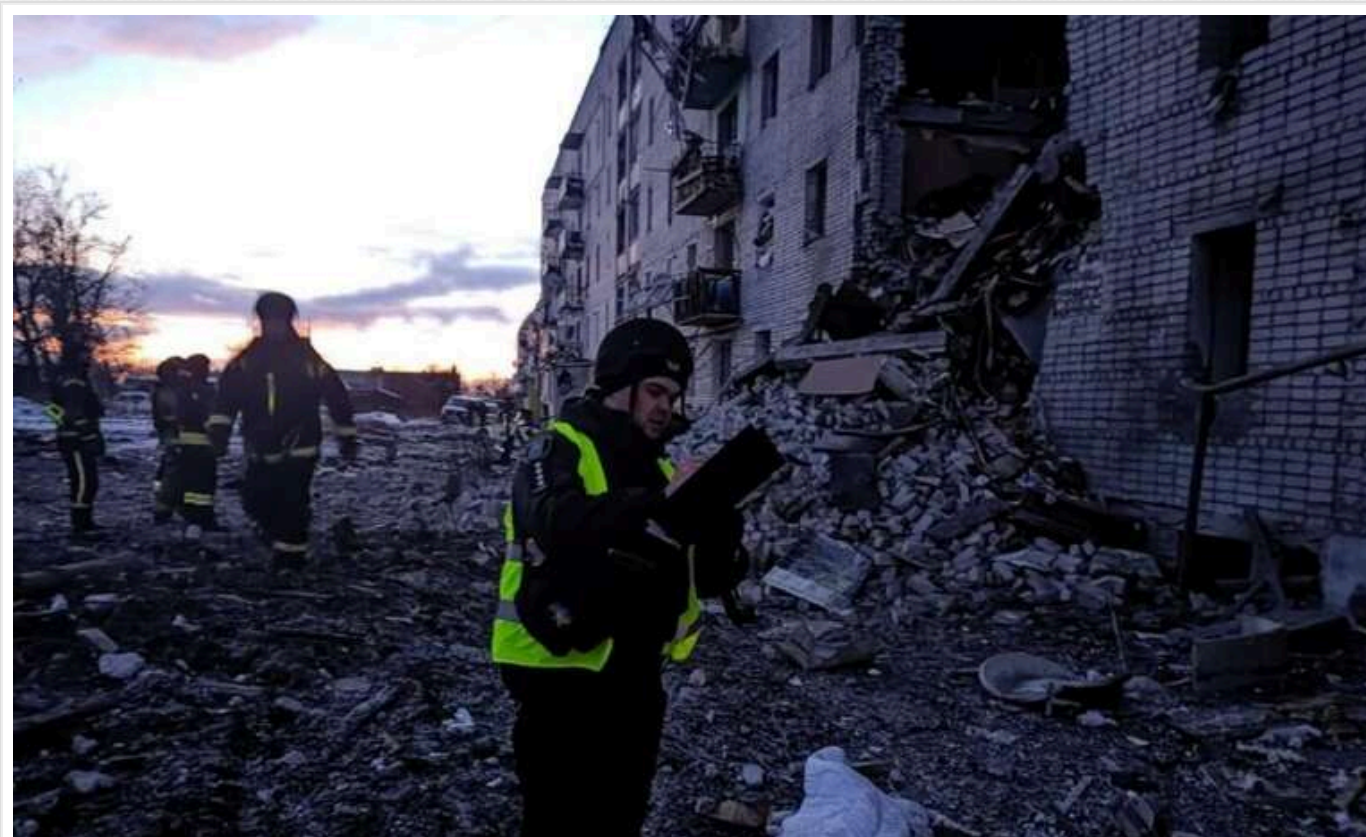
На Сумщині зросла кількість поранених внаслідок російського авіаудару

На Сумщині кількість поранених внаслідок російського авіаудару збільшилася до п'яти, серед них двоє дітей.