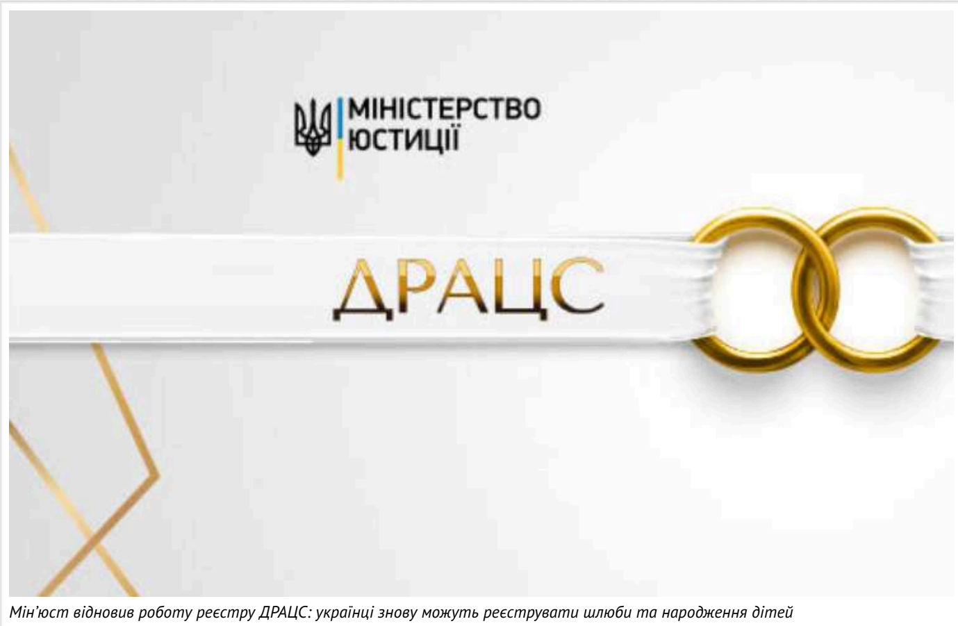
Мін'юст відновив роботу реєстру ДРАЦС: українці знову можуть реєструвати шлюби та народження дітей

Міністерство юстиції України повідомило про відновлення роботи реєстру актів цивільного стану (ДРАЦС), зупиненого через масштабну кібератаку в грудні. Тепер громадяни знову можуть офіційно оформлювати шлюби, реєструвати народження дітей, розлучення та інші події цивільного стану.