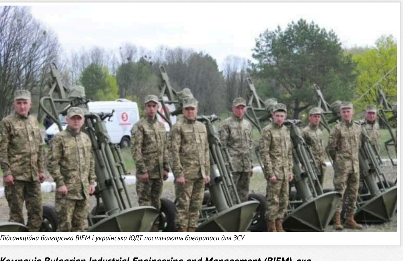
Підсанкційна болгарська BIEM і українська ЮДТ постачають боєприпаси для ЗСУ