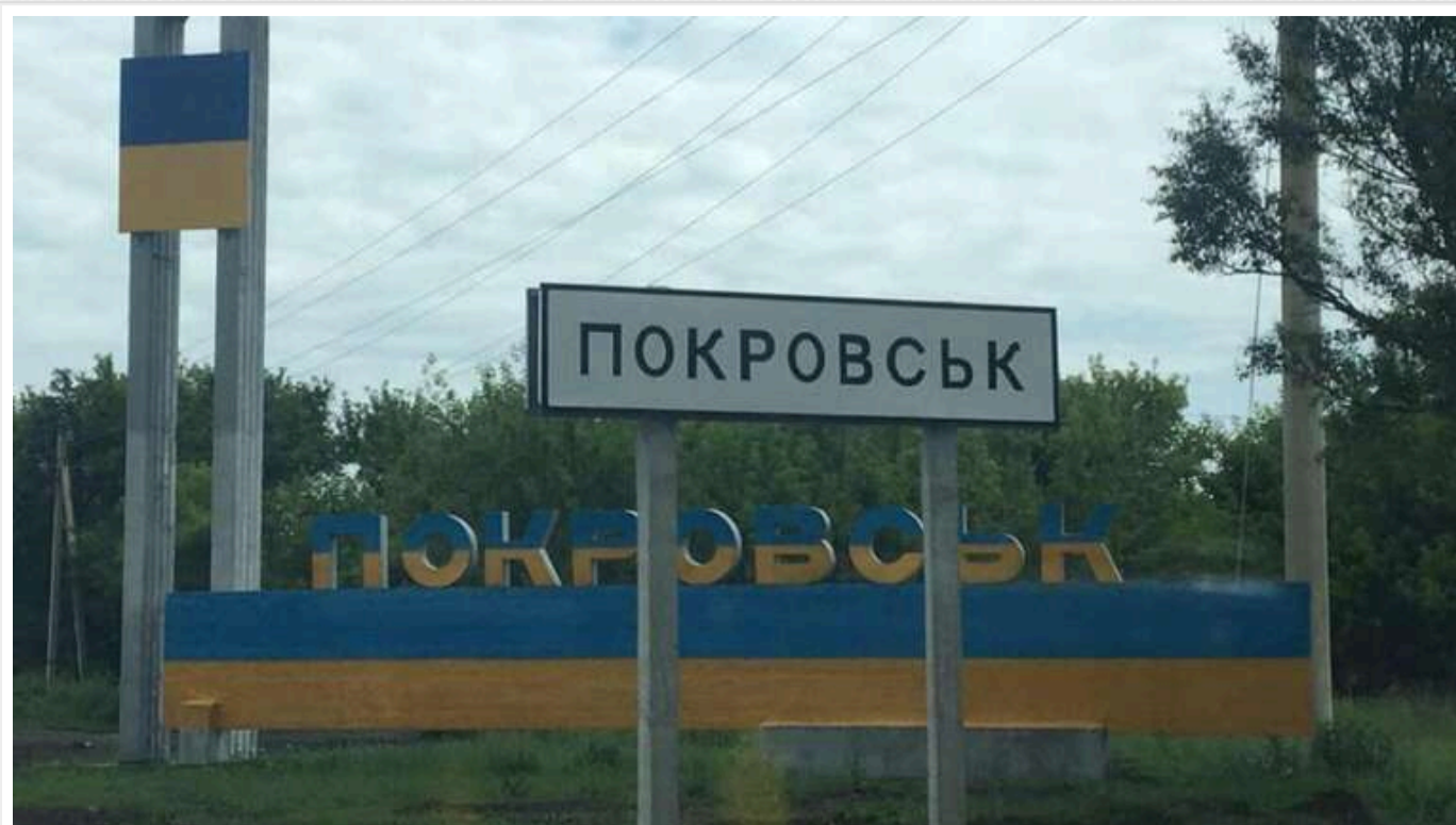
В ЗСУ пояснили, чому Покровськ такий важливий для Путіна

У районі Покровського напрямку в Донецькій області росіяни сконцентрували понад 70 тисяч військовослужбовців, щоб не просто оточити це місто, а й перервати логістичні зв'язки ЗСУ.