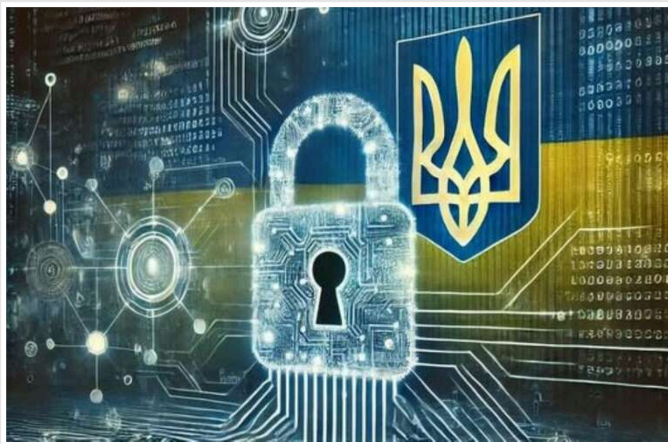
В Україні відновили реєстр актів цивільного стану після масштабної кібератаки

Міністерство юстиції повідомило про повне відновлення роботи реєстру актів цивільного стану, який постраждав унаслідок кібератаки. Інформацію про всі шлюби, розлучення, народження та смерті, які фіксувалися в паперовому вигляді під час зупинки реєстру, тепер вносять до бази.