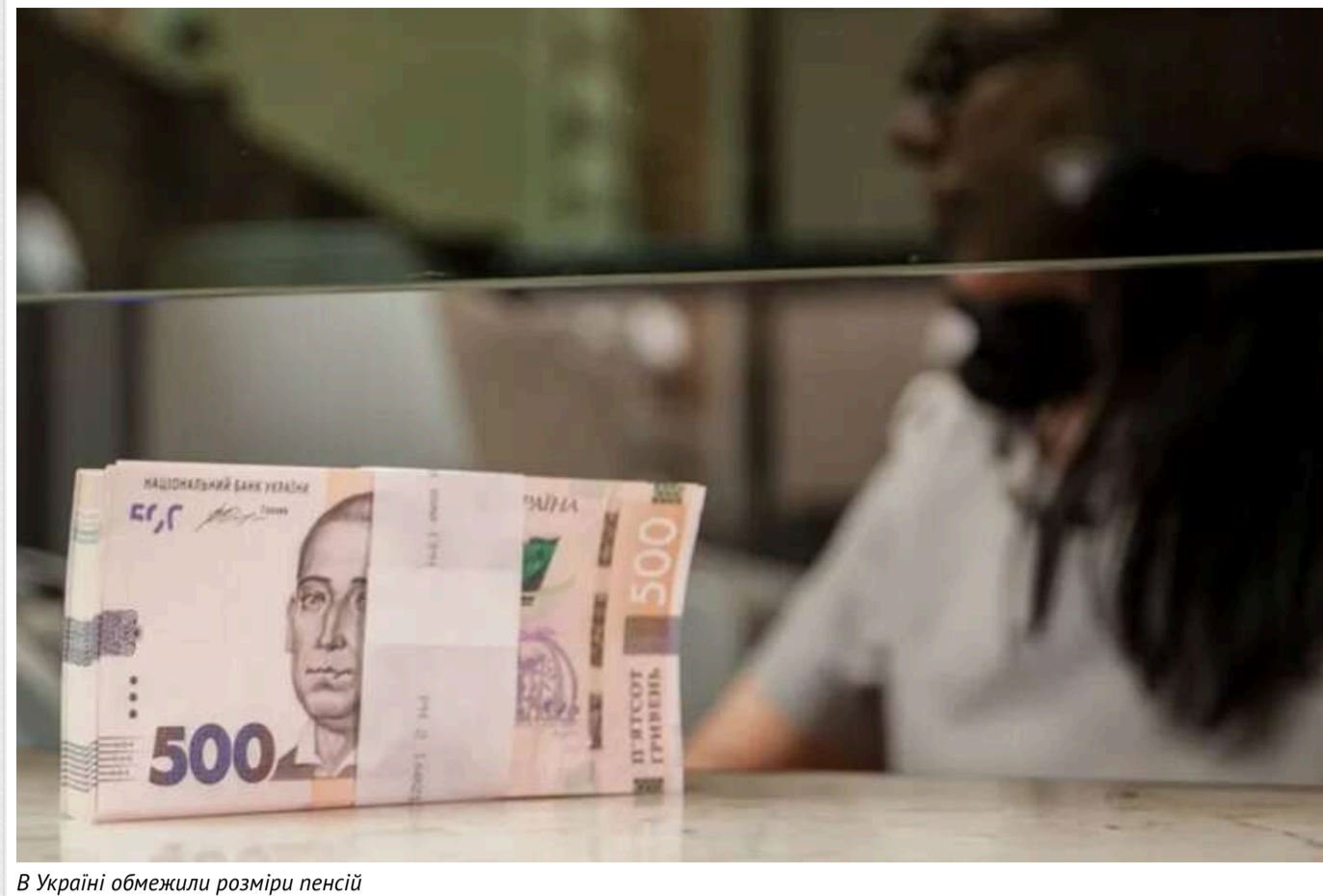
В Україні обмежили розміри пенсій

В Україні у 2025 році був обмежений максимальний розмір пенсії. Така норма закладена в державному бюджеті та стосується пенсій, які в 4 рази або більше перевищують середню пенсію по країні, чи 10 прожиткових мінімумів для працездатних осіб.