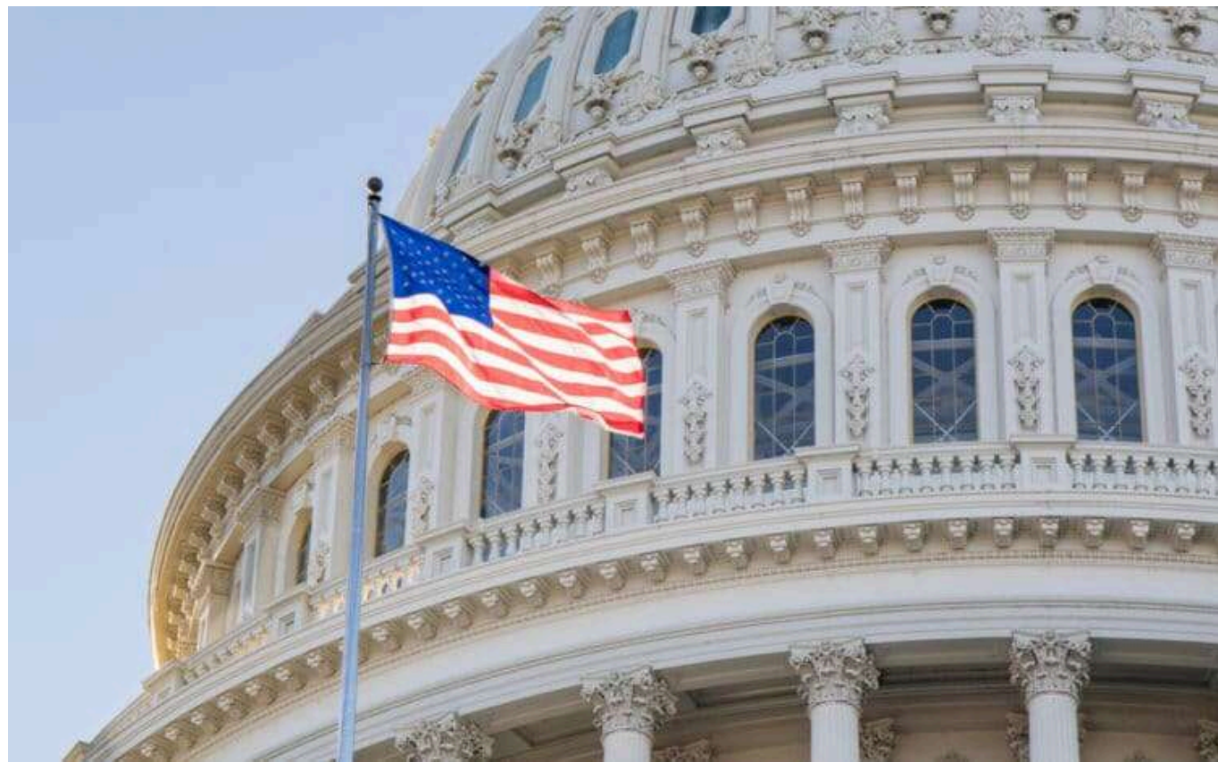
У Вашингтоні здійснили підготовку до "загрози" після терактів 1 січня

Правоохоронці у Вашингтоні перейшли в режим "підвищеної загрози" після терактів на Новий рік. У США незабаром відбудуться три резонансні події.