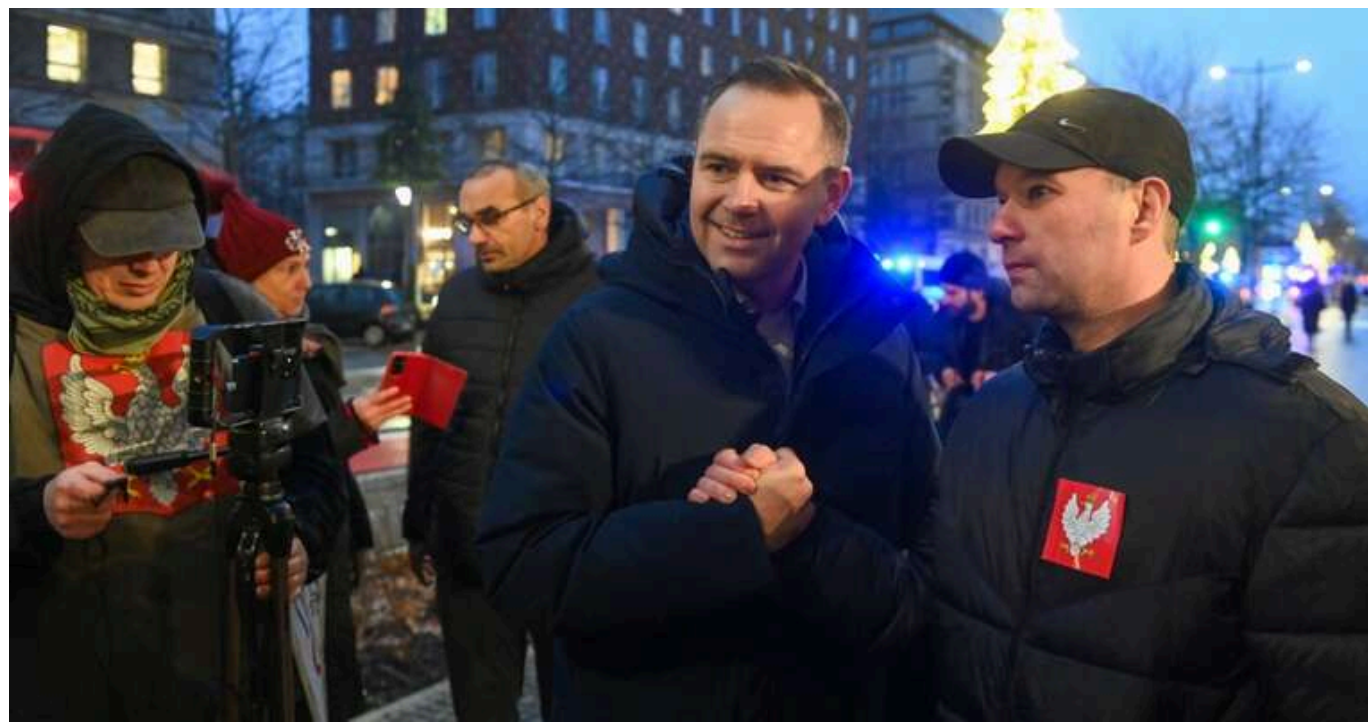
У Польщі один з кандидатів в президенти взяв участь в протесті фермерів

Один із кандидатів у президенти Польщі, Кароль Навроцький, взяв участь у протесті фермерів. Уряд різко відреагував на цей крок.