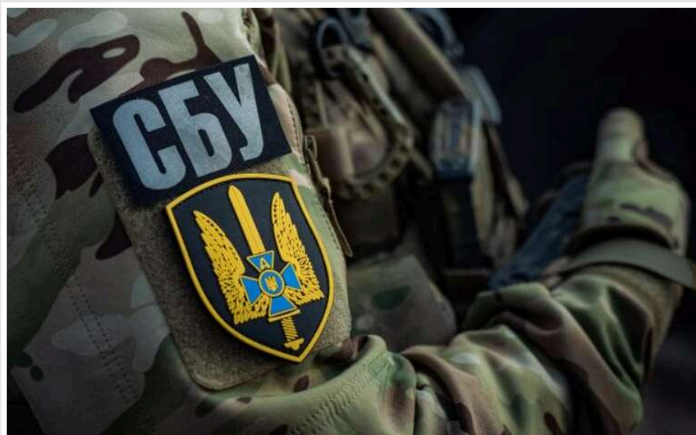
Служба безпеки України викрила на Закарпатті схему ухилення від призову на службу під час мобілізації

На Закарпатті Служба безпеки України (СБУ) ліквідувала чергову схему ухилення від мобілізації та нелегального виїзду чоловіків за кордон. Серед підозрюваних посадовці лікарень.