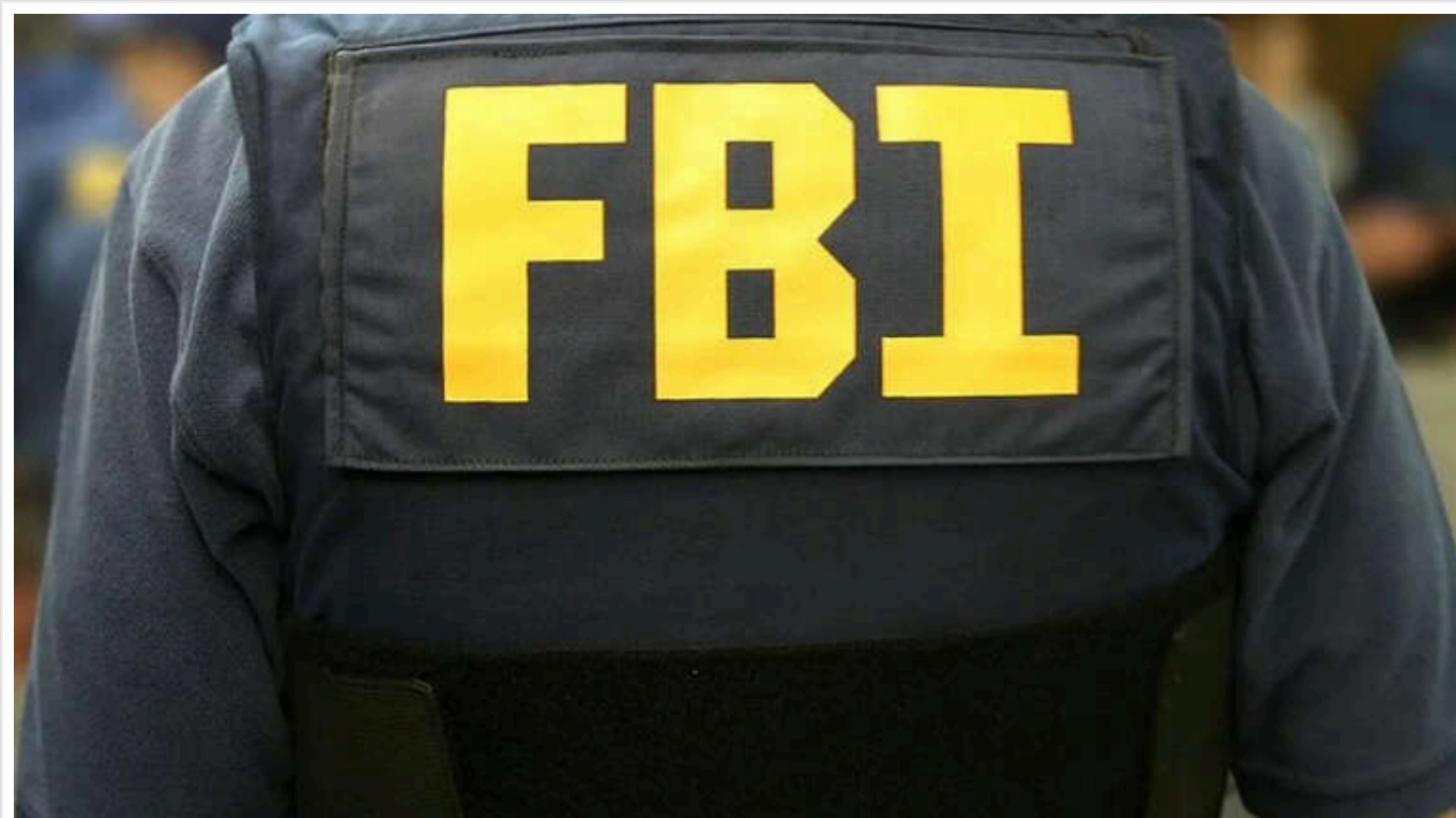
ФБР знешкодило дві бомби, закладені терористом у Новому Орлеані

ФБР знешкодило два саморобних вибухових пристрої в Новому Орлеані, які були закладені терористом Шамсуд-Діном Джаббаром у перший день 2025 року.