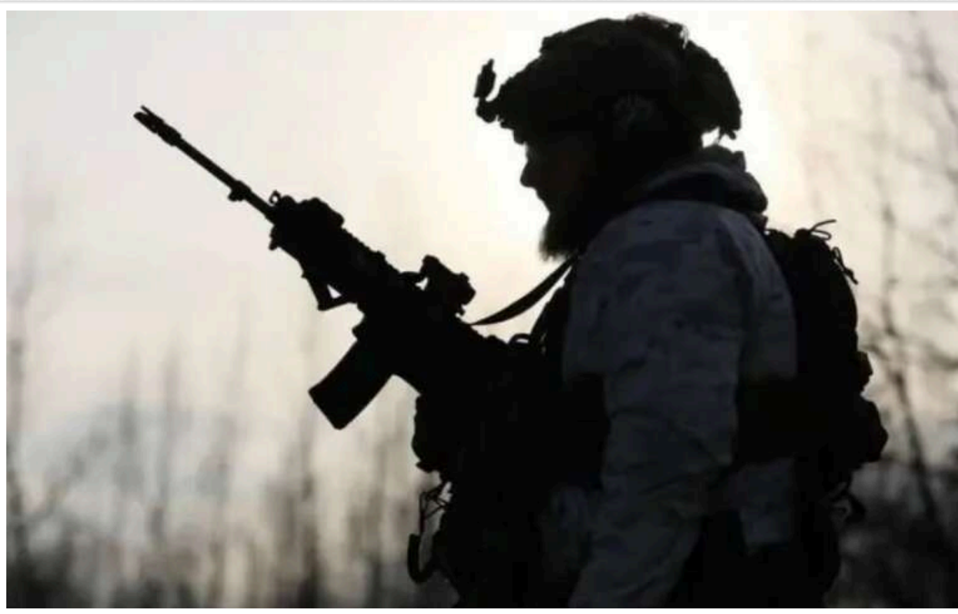
Forbes: Оборонців Покровська можуть підсилити військовослужбовцями з відомої 155-ї ОМБр

59-та моторизована бригада, яка обороняє Покровськ, може отримати підкріплення з-поміж бійців 155-ї ОМБр, що припускає видання Forbes. Наразі ця ділянка є найбільш загрозливою з погляду російської агресії.