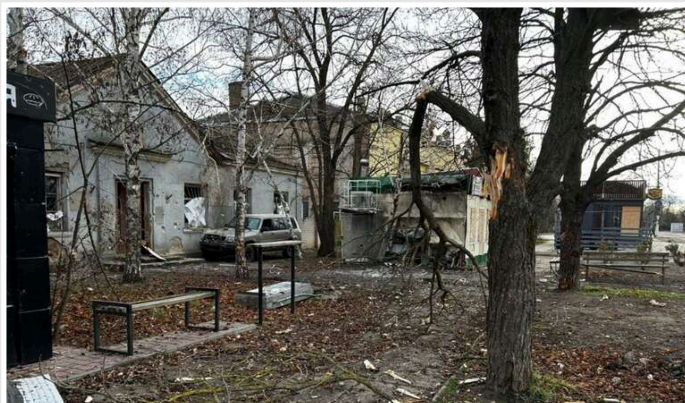
В Антонівці під атаку російського дрона потрапив 68-річний чоловік

У передмісті Херсона – селищі Антонівка від удару російського дрона постраждав 68-річний чоловік.